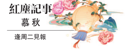
紅塵記事 慕秋 逢周二見報

動。當我們登上「瀟湖之星」觀光塔，在旋轉餐廳下望，也不禁為風中垂柳的美妙畫面讚嘆。三月底穿越長江抵達揚州時，突然發現柳樹枝條短了許多，想來是溫度影響所致，當太陽暴曬兩日後，枝條便很快長長了。