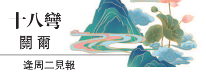
十八彎 關爾 逢周二見報

星吶喊加油，最後發現自己瘋狂投入的，只是骯髒交易後的假象，那種感覺比生吞了「小強」還要讓人不適。這種賽場腐敗與黑幕，對社會公信力的透支與傷害，又該如何救贖？奧林匹克之父顧拜旦說過：「重要的絕非凱旋，而是戰鬥！」讓體育回歸純粹，讓金牌保持乾淨，奧林匹克精神才能繼續點燃夢想與榮光。