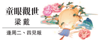
童眼觀世 梁戴 逢周二、四見報

定期聚會，往來多是京城文化名人。一九二四年春，徐志摩在這裏掛出「新月社」的牌子，在中國現代文學史上有着重要影響力的文學流派就此誕生。「新月社」之名，是徐志摩根據泰戈爾詩集《新月集》所起，意在以「它那纖弱的一彎分明暗示着，懷抱着未來的圓滿。」