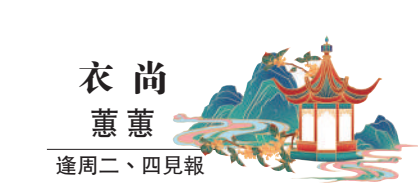
衣尚 蕙蕙 逢周二、四見報

染髮除了是潮流趨勢，亦可以成為遮蓋白髮的良方，當中最普遍的當然是染黑色，喜歡比較自然顯色的，也可選擇深啡色。以啡色調來說，可選啡紅色，比較更時尚一點的，可選流行帶霧感的奶茶色，或是茶棕色。髮型師也提議可選擇流行的線條染，混合兩種不同色調，不過這都是適合白髮量少，也不大明顯的情況使用，若白髮較多仍應選擇深色調為主。以前染髮是因為白髮，而現時染髮已成為時尚流行傾向，也為日常生活平添一點樂趣。但無可否認，若經常頻密染髮，對髮質會有損害，要注意染髮後的保養工作，最重要是保持髮質的柔軟和光澤，否則髮型再多色彩變化，也是得不償失的。