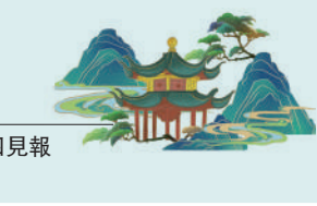
食色判答 逢周二、三、四見報

在意大利的西西里島，流傳着這樣一句話：除非它是西西里的檸檬，不然無法算作一顆真正的檸檬。那個曾在春天尾巴上起舞、在無數飲品裏叛逆、也曾叫醒我們舌尖的水果，是這座南意城市最大的驕傲，以至於在《天堂電影院》中，開篇鏡頭就是桌上一盆明亮的嫩黃。但更多人知道西西里檸檬，還歸功於諾貝爾文學獎得主、意大利作家皮蘭德婁的小說《西西里檸檬》，在他的字裏行間，最活力四射光彩照人的水果，卻帶着最酸楚、孤獨的味道。幸好，我們不用去體會小說主人公的苦澀，但卻能踏足西西里，置身於夢境一般的檸檬樹下，呼吸芬芳和快樂。如今遊歷在這土地上、貪婪而迫切的人們很難再記得，一顆神奇的果實從公元七世紀傳入伊拉克、埃及，又經過了三個世紀，開始在阿拉伯地區規模性地種植，直到十五世紀，它的種子才生根發芽、播撒在熱那亞的土壤上。在意大利，西西里是檸檬的主要產地，而距它不遠的阿瑪爾菲也同樣以大片檸檬樹享譽四方，你要透過一顆顆檸檬果的影子，才能招呼到頭頂豔陽，再轉過頭，身邊幾乎所有店鋪、櫥窗邊，都是跟檸檬相關的元素。對每一個到這裏旅行的亞洲人來講，南意的檸檬沒有任何攻擊性，可口、溫順得足以顛覆認知。果皮從不打蠟，果實個頭大核少，酸甜多汁、能單獨食用。每在這裏多呆一天，尖銳難搞的刻板印象就能減弱一分，並且會見證自己從小心翼翼，到毫無顧忌食指大動的全過程。可以說在南意，人們餐桌上的主角除了海鮮，就是各種檸檬飲料和檸檬味道的甜品了。它的產期也很長，橫跨夏秋，幸運的話能看到果農背着滿是檸檬的籃子拾級而下，在幾個世紀的滄桑風雨中，鮮亮如昨。