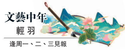
文藝中年 輕羽 逢周一、二、三見報

兀突的戲劇性衝突，令劇情變得誇張失實。不過，全劇有另一種特色，主角們在舞台化的場景，以自白方式向觀眾述說內心所想，一方面作為編劇的代言人，另一方面亦以抽離方式讓觀眾評議劇情，令肥皂式故事增添新意。