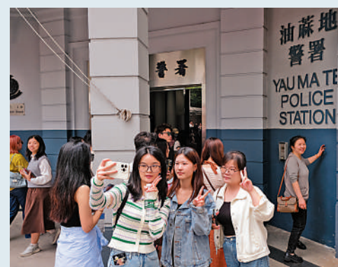
▲來港旅客數字不斷回升，「旅遊義工」計劃可展示好客之道，讓旅客有賓至如歸感覺。