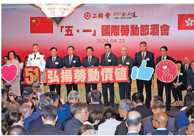
▲工會聯昨日舉行「五一」國際勞動節酒會。

香港去年的施政報告提出檢討俗稱「418」的「連續性合約」規定，推行再就業津貼試行計劃，同時優化法定最低工資的檢討機制。今年2月，香港勞工顧問委員會就檢討「418」規定達成共識。李家超表示，在與勞工團體協商後，勞工處將於今年第三季推行「再就業津貼試行計劃」。政府亦正推進釐定優化法定最低工資的檢討機制。展望未