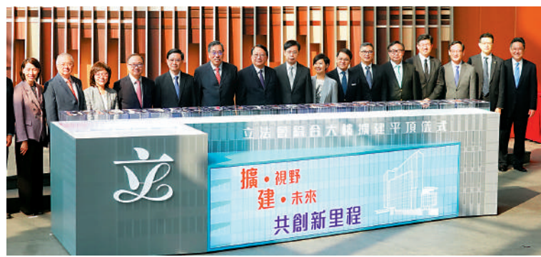
▲立法會綜合大樓擴建平頂儀式昨日舉行，特首李家超與一眾官員議員出席。

【大公報訊】記者龔學鳴報道：因應新一屆全體立法會議員人數由70人增至90人，立法會綜合大樓於原址擴建，昨日進行平頂儀式。出席儀式的行政長官李家超與全體議員一起切金豬慶賀。李家超隨後在社交平台上表示，特首辦和政府總部與立法會比鄰而設，有如行政與立法關係一樣密切，期望繼續透過行政長官立法會互動交流答問會和立法會前廳交流會等平台，加強官員與議員之間的良