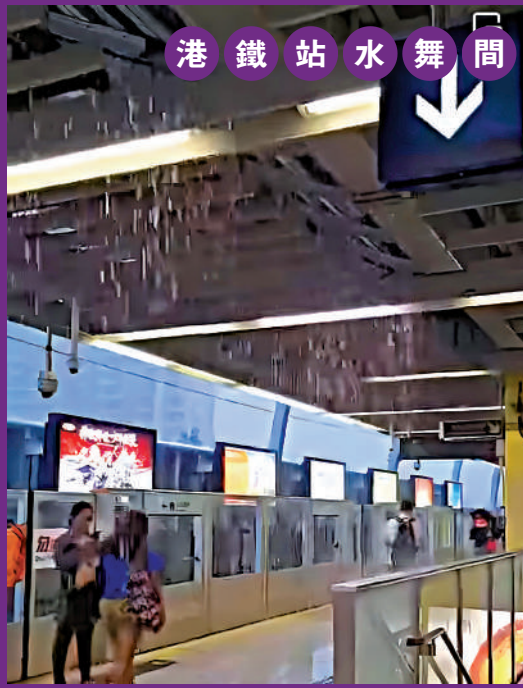
▲港鐵石門站月台頂部漏水，仿如水舞間。