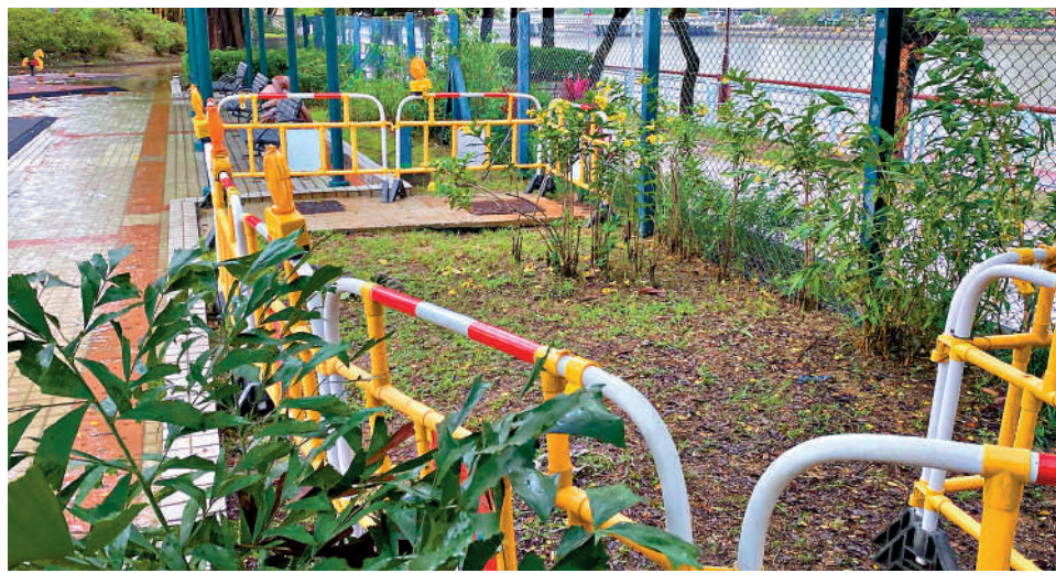
▲沙田源禾遊樂場沙井昨凌晨發生奪命工業意外，兩名工人死亡。