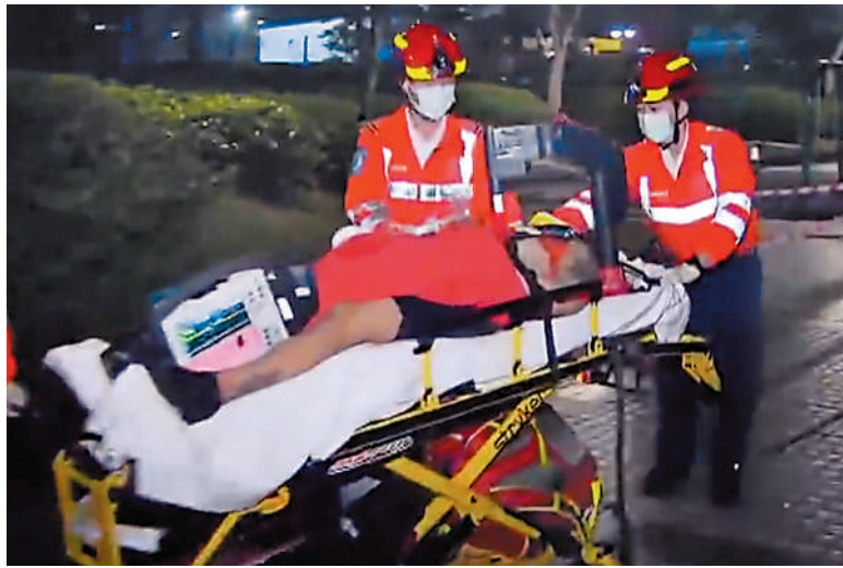
▲沙井沼氣事故工人送院搶救。