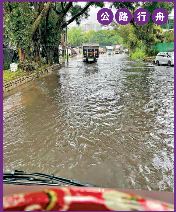
▲流浮山屏廈路發生嚴重水浸。