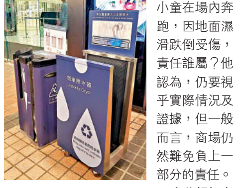
部分商場開始向顧客提供雨傘除水器。