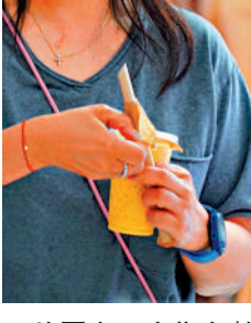
外國有研究指多數紙飲管含有致癌物，惟本地供應商表明產品全部通過安全測試。