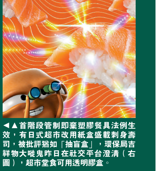
首階段管制即棄塑膠餐具法例生效，有日式超市改用紙盒盛載刺身壽司，被批評猶如「抽盲盒」，環保局吉祥物大唯鬼昨日在社交平台澄清（右圖），超市堂食可用透明膠盒。

首階段措施下，膠杯、膠碗、膠飯盒包括膠蓋、封口膠膜，可以外賣使用，但禁止堂食使用。日式連鎖超市DON DON DONKI近日將盛載刺身或壽司盒，改用附有壽司照片的密實紙盒盛載，並在門口及凍櫃位置貼出告示，標明「法例規定堂食不可使用塑膠即棄容器」，場內另有以透明膠盒包裝的壽司供顧客外賣，紙盒包裝壽司貼有「只供在店內享用」字句。不少顧客質疑，壽司講求新鮮，包裝轉用紙盒難以看清楚，如同「盲盒」，降低購買意欲。 環境及生態局的吉祥物「大唯鬼」，昨日在