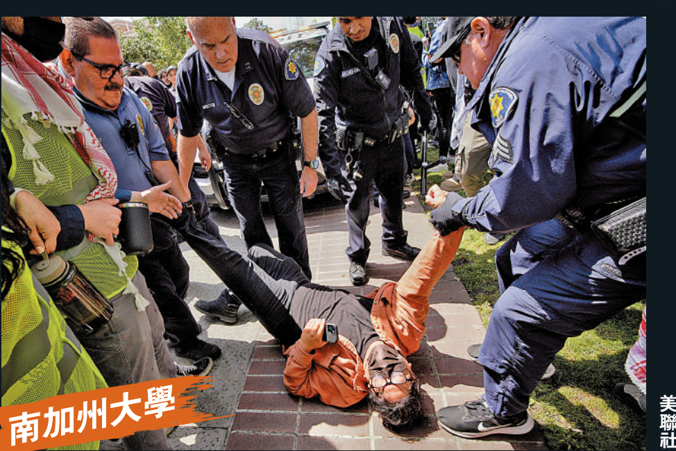
南加州大學一名示威者被校方公共安全部職員控制。