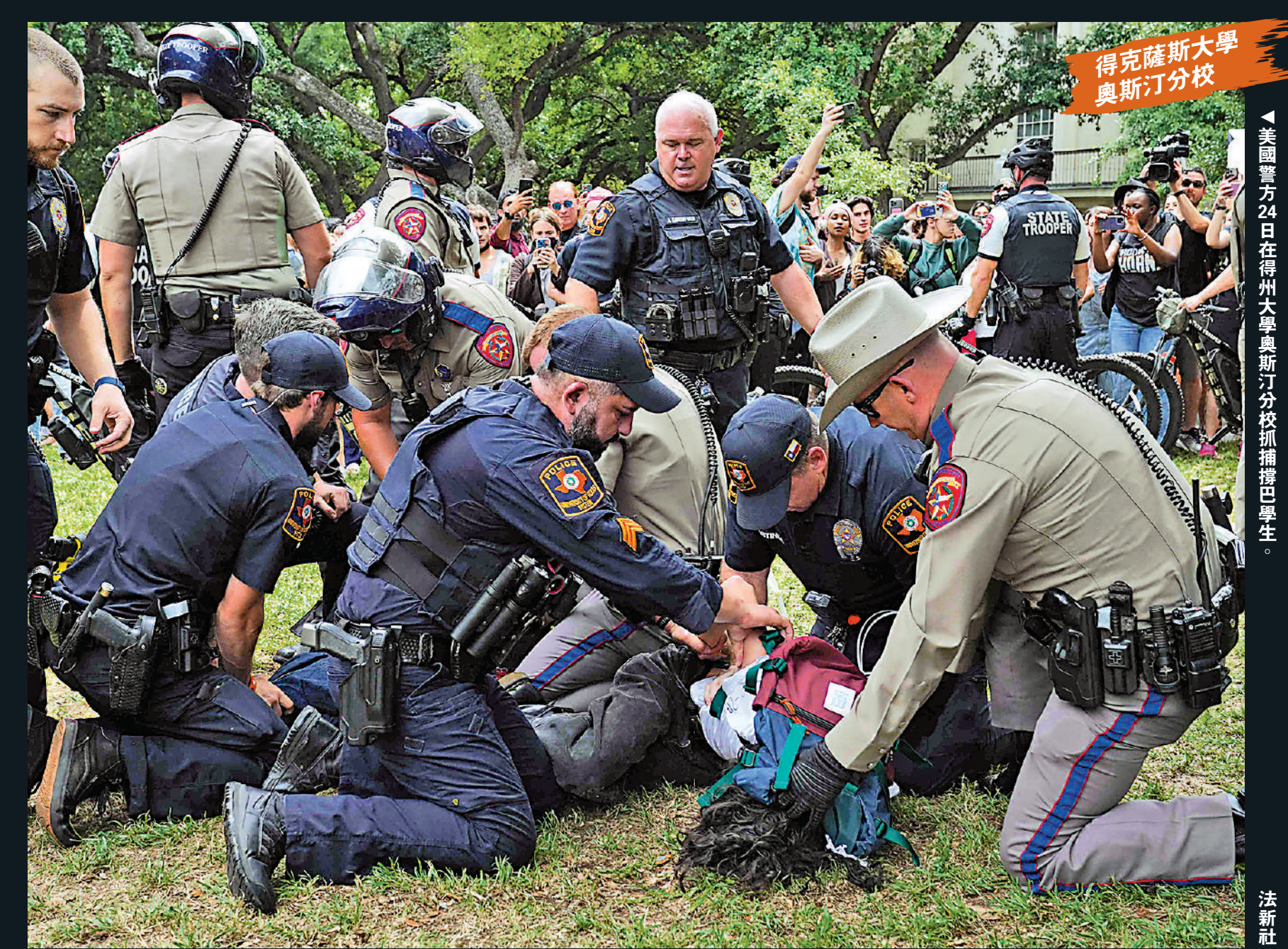
美國警方24日在得州大學奧斯汀分校校園捕獲學生。