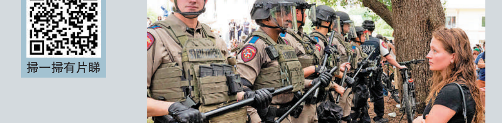
得州州警24日在得州大學奧斯汀分校與示威者對峙。