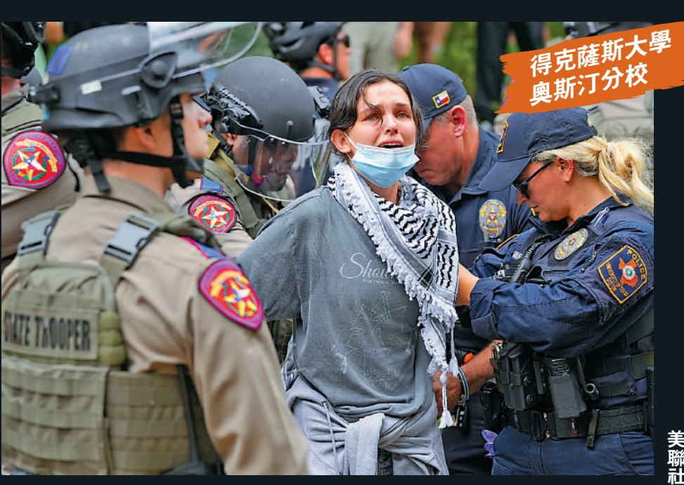
一名奧斯汀分校的學生示威者被捕。