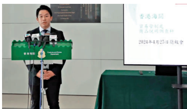
海關記者會講述 Choco Cloud Kids 案件。該店突然結業，自提點人去門關。

另據一名在該公司曾任職會計的前員工爆料指，該店老闆於2021年以公司名義，參與「中小企融資擔保計劃」，由政府提供信貸擔保承擔額，成功向銀行申請「百分百擔保特惠貸款」，總數逾280萬港元，老闆成功貸款後，隨即將巨額貸款，由公司戶口轉至私人戶口，其後更向員工宣稱已在內地買樓，及正申請移民英國。質疑有人已鋪好路，去呢市民和政府的錢後，移民「走佬」。