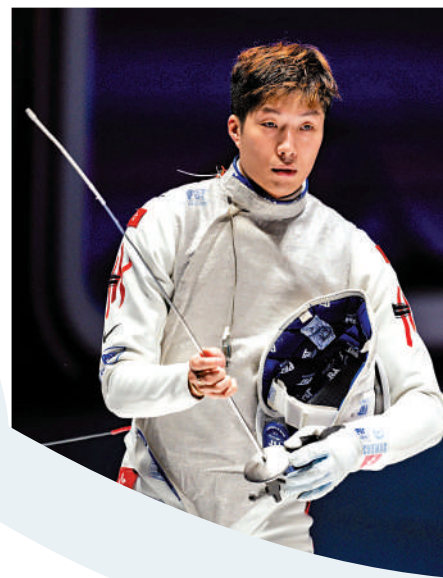
▲張家朗在巴黎奧運肩負衛冕重任。