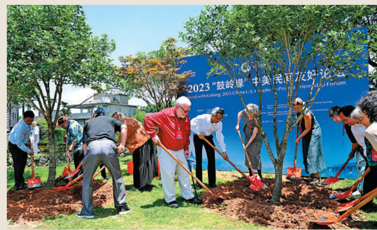
◀ 2023「鼓嶺緣」中美民間友好論壇在福建省福州市舉辦，出席「鼓嶺之友」座談會的中美各界人士在鼓嶺共同植樹留念。

王毅表示，美國大選是美國內政，中方從來沒有也不會干涉別國內政，這不是中方的行為方式。不管誰當選下一屆美國總統，中美兩國人民還是要交流合作，中美兩個大國必須找到正確的相處之道。習近平主席提出相互尊重、和平共處、合作共贏三原則，這是我們看待和處理中美關係的基本遵循和努力方向。前不久，習近平主席應約同拜登總統通電話，再次指出中美這樣兩個大國，不能不來往、不打交道，更不能衝突對抗，應該堅持以和為貴、以穩為重、以信為本。王毅說，中美關係回不到過去，但應該也完全能夠有一個好的未來。中方願與美方一道，多做合作共贏的好事，多辦惠及世界的大事，切實承擔各自應盡的國際責任。