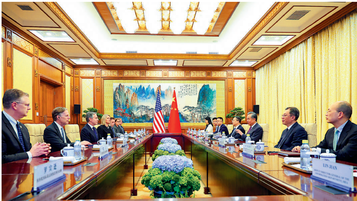
◀ 4月26日，中共中央政治局委員、外交部長王毅在北京同美國國務卿布林肯舉行會談。王毅表示，中方對於中美關係的態度、立場、要求一以貫之。

4月26日，中共中央政治局委員、外交部長王毅在北京同美國國務卿布林肯舉行會談。王毅說，當前，中美關係總體止跌企穩，但負面因素仍在上升積聚。中方對於中美關係的態度、立場、要求一以貫之，始終從構建人類命運共同體出發看待和發展中美關係，始終堅持習近平主席提出的相互尊重、和平共處、合作共贏原則，始終主張尊重彼此的核心利益。王毅強調，希望美方作出正確抉擇，與中方相向而行，在亞太實現良性互動，放棄搞排斥對方的小圈子，不要挾迫地區國家選邊站隊，停止損害中國戰略安全利益。