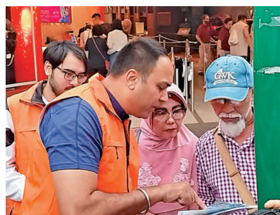
▲警方將於五一黃金周安排「的士大使」協助乘客在登車時記錄預計車資、的士車牌號碼等資料在的士資訊卡上。

【大公報訊】記者古偉勳報道：臨近內地五一黃金周，預計將有大量旅客訪港。警方本月初聯同多個組織機構在蘭桂坊推行「的士大使計劃」以打擊「黑的」，在的士站派發資訊卡及目的地預計車資等，計劃已見成效，因此在5月1日至5日5日黃金周期間，計劃會擴展至山頂及花園道纜車站，讓留港旅客有更好的體驗。