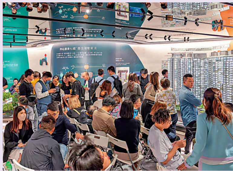
▲朗賢峯昨日首輪開賣，售樓處氣氛熱鬧。