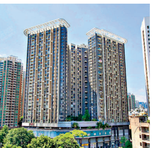
▲祥雲天都世紀共3幢，提供1120伙。

配套完善 祥雲天都世紀坐落於福田新洲三路和福強路交匯處，共3幢，提供1120伙，自帶商場及空中花園。項目於2005年建成，樓齡19年，在新洲片區相對較年輕。祥雲天都世紀戶型多元化，面積由34至98平米，間隔由開放式至三房兩廳，每平米均價約6.25萬元（人民幣，下同），入場費214萬元。