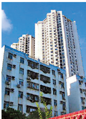
▲新洲花園分兩期發展，由多層及高層物業組成。