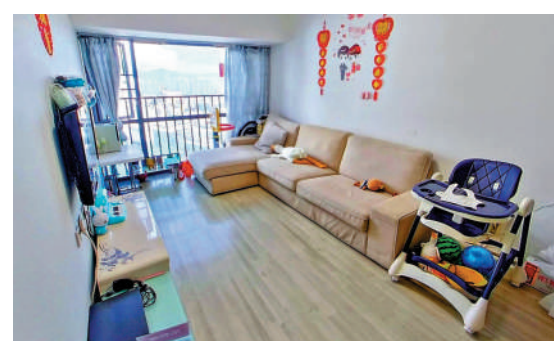
▲祥雲天都世紀間隔由開放式至三房兩廳。

小區周邊有地鐵7號線沙尾站和上沙站，1站到石廈站可以換乘3號線，2站到車公廟站可換乘1號線、9號線和11號快速線，3站到福民站可換乘4號線，基本可以通達全市。主幹道濱河大道和京港澳高速貫穿寶