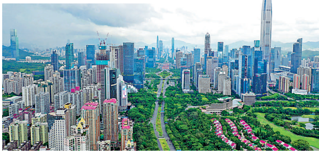
▲福田金融中心繁華熱鬧，毗鄰的新洲片區享受市中心優質城市配套。