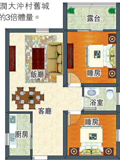
▲祥雲天都世紀80平米兩房兩廳戶型圖。

目前，小區周邊的大金沙舊城改造，包括沙尾村、沙嘴村、上沙村、下沙村、金地工業區等，政府投入300億元打造的福田最大舊改片區，由綠景、金地、中洲、京基四間地產商開發，將會發展成總建築面積350萬平米住宅和412萬平米產業空間，預計可容納16萬人居，是華潤大沖村舊城改造的3倍體量。