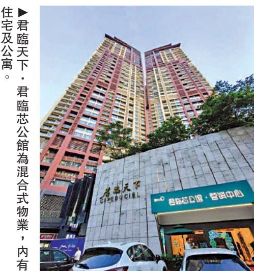
住宅及公寓。君臨天下·君臨芯公館為混合式物業，內有

皇庭廣場、星河COCO Park、購物公園、卓越INTOWN購物中心、卓越中心等。