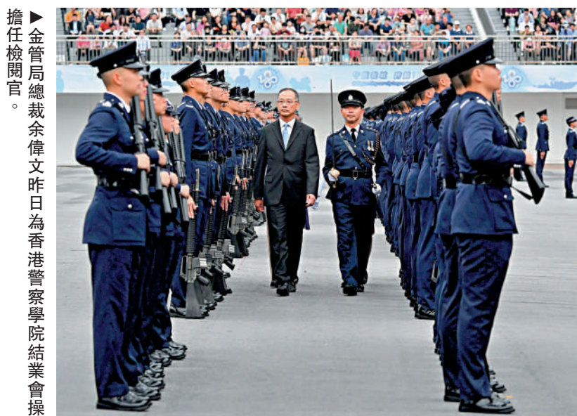
▶金管局總裁余偉文昨日為香港警察學院結業會操擔任檢閱官。

【大公報訊】記者龔學鳴報導：香港警察學院昨日舉行結業會操，擔任檢閱官的香港金融管理局總裁余偉文致辭時表示，金融體系的安全與社會安全穩定是相輔相成，只有在社會安全穩定的基礎上，金融安全才得以保障，金融發展才能夠更上一層樓。過去幾年警隊不遺餘力維護國家安全和維持社會秩序，為金管局大力推動香港國際金融中心發展的工作，創造非常有利的環境。