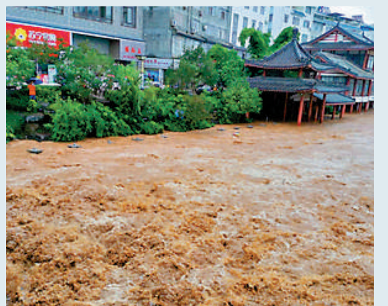
▲2020年8月強降雨導致河水漫上廣西蒙山街道。