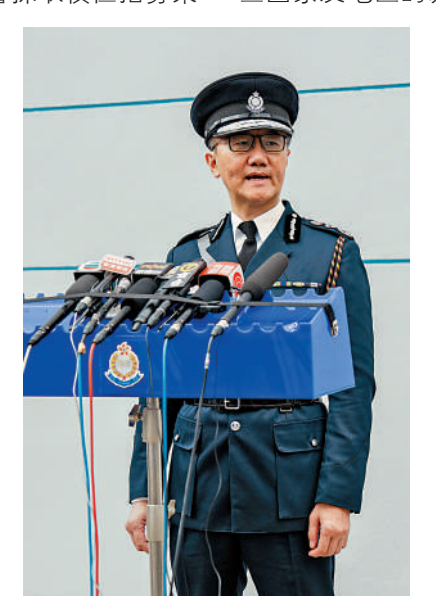
▲警務處處長蕭澤頤指出加裝閉路電視成效顯著。

效非常顯著，已有兩宗較嚴重案件分別透過閉路電視協助偵破，包括有仿製火器及行劫案，共拘捕四人，警方會研究優化，今年年中於不同地區罪案黑點共安裝600組閉路電視，於下個財政年度再安裝餘下的一千多組。他重申安裝閉路電視目的是協助防罪減罪，世界上很多不同國家有相關做法，英國已安裝900萬支，新加坡已安裝9萬支，那些國家及地區的罪案率在安裝閉路電視後有明顯下降，警方已根據私隱專員公署及市民意見，優化試點閉路電視安排，包括將告示放於較低位置，相關二維碼明顯放大，以及加入聯絡警方的電話號碼，強調會按照相關法例、條例及指引，確保市民大眾的私隱得到充分保障。