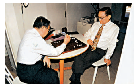
▲查良鏞（金庸，右）與梁羽生（左）經常對弈。

到，金庸創作的許多故事是在中國西部的戈壁長河、峻嶺和莽原中展開的，「華山的剛柔互濟和金庸小說的俠骨柔腸，構成了同構和共情的場域。我想這恐怕是他已近耄耋之年，還要不遠萬里去華山踐行他的少年之約的主要原因。」華山之行中，金庸最後在華山山頂參加了名家論道，「先生在華山上主要談了兩個意思，他說他寫武俠小說是因為中華民族太過苦難，需要理想主義、豪邁氣質的培育，使我們民族精神健全起來。第二，他談到他寫武俠小說，在具體的武俠故事背後是一個寓言，這個寓言是指向民族精神和人格力量，以劍俠故事引向國之大者。」