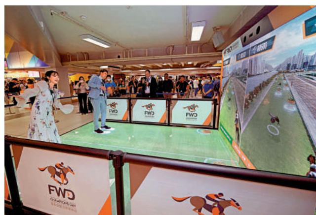
▲海外傳媒參加「賽馬快訊」冠軍之路」對戰比賽，化身騎師體驗賽馬運動。