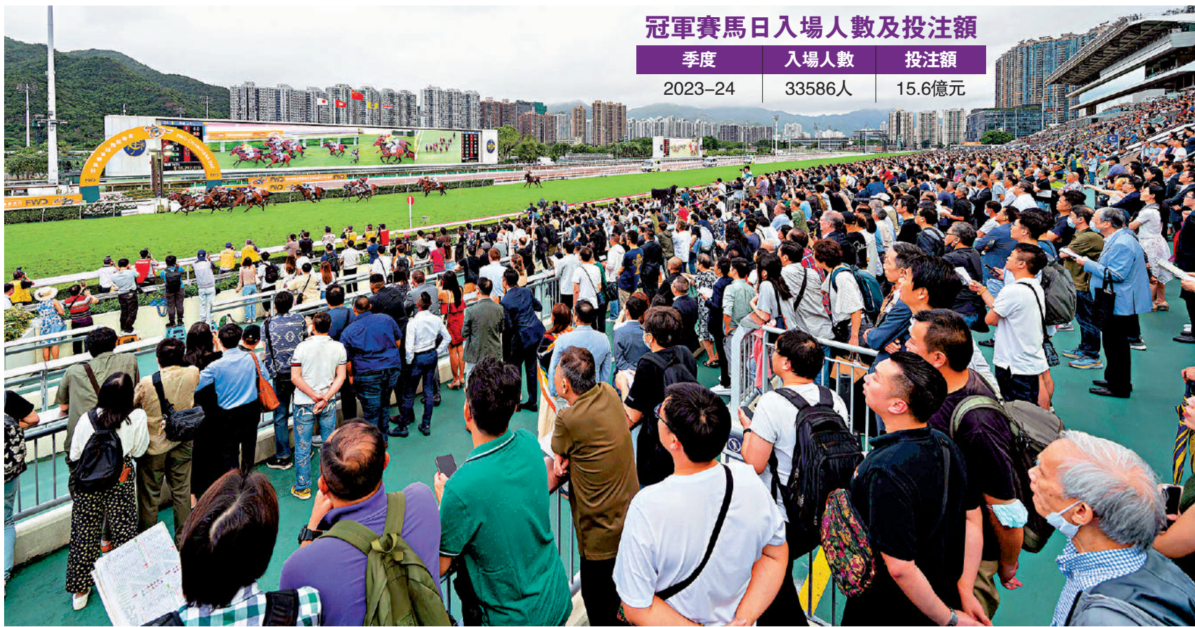
冠軍賽馬日入場人數及投注額

冠軍一哩賽的總獎金將由2200萬元增至2400萬元，增幅達9.1%；香港一哩錦標的總獎金將增加400萬元至3600萬元，增幅達12.5%；香港盃的總獎金亦將增加400萬元至破紀錄的4000萬元，增幅達11.1%，繼續成為香港獎金最豐厚的賽事。