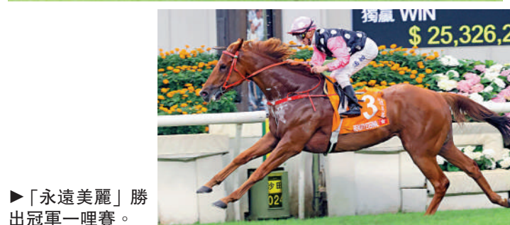
▶「永遠美麗」勝出冠軍一哩賽。