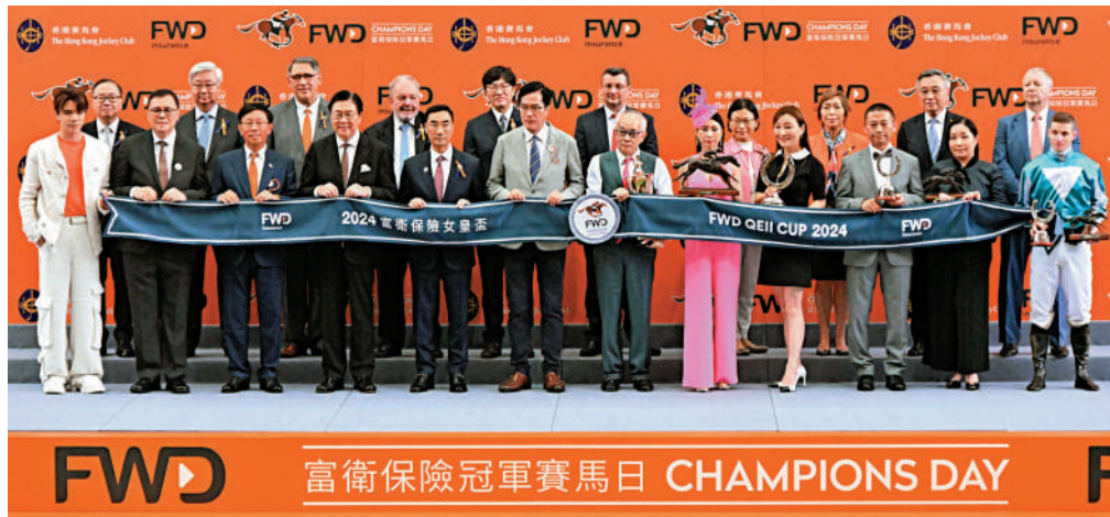
▲女皇盃頒獎禮合照。