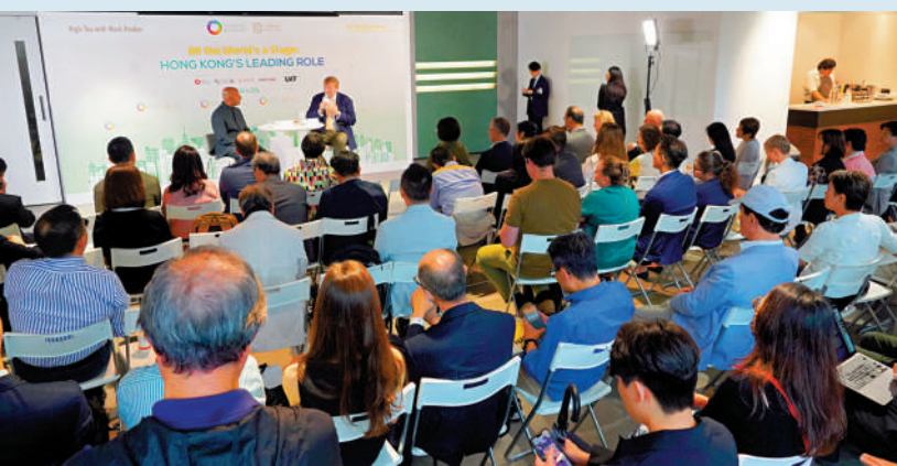
▲團結香港基金會日前舉辦「我們的香港故事」系列講座，與會者分享對香港的熱愛。