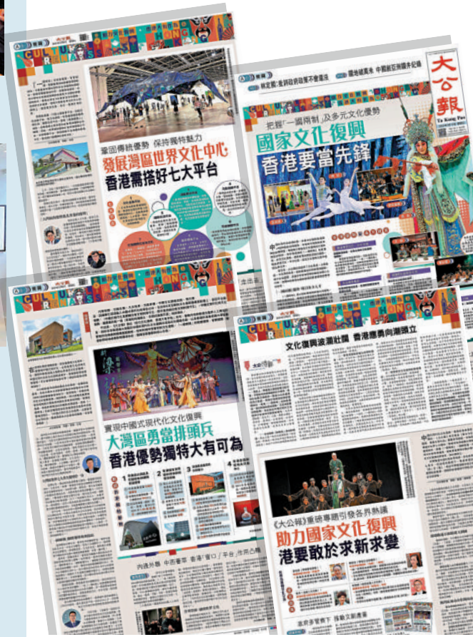
▲《大公報》上月起推出「助力文化復興 香港大有可為」系列報道，探討香港應如何建設好中外文化藝術交流中心，引起社會熱烈反響。

皮克具備宏觀的歷史觀，喜歡中華文明，「中華的歷史也是世界的歷史。」對於「一國兩制」下的香港未來發展，他充滿信心：「建設一個嶄新而獨特的香港，需要政府、企業家、商界和社會界的共同努力。這就是我們的獅子山精神。」