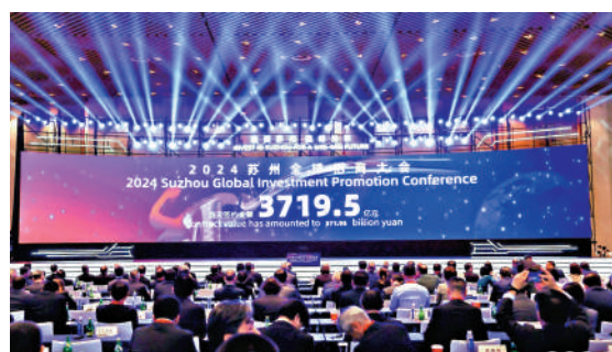
26日，在2024蘇州全球招商大會上，367個項目簽約，總投資3720億元人民幣。

近日，江蘇蘇州舉行了全球招商大會，世界500強企業來了429家，其中，重量級的外籍嘉賓多達200多位，大量項目現場簽約。大會上，367個項目簽約，總投資3720億元人民幣，一批新能源、高端裝備、新一代信息技術、先進材料、生