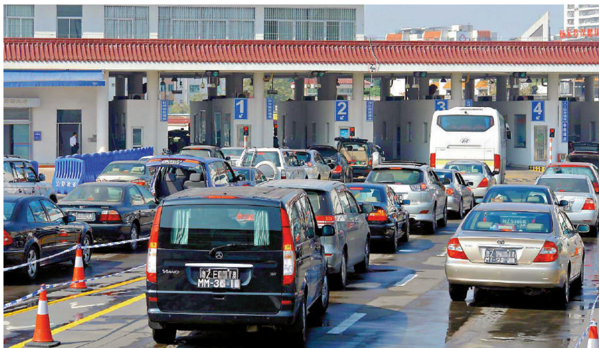
5月1日起，粵港澳兩地牌車輛管理推出4項便利措施。圖為兩地牌車出入境。

因此，不論是「澳車北上」「港車北上」，政策還是粵港澳兩地牌車輛管理優化便利措施，均進一步促進粵港澳三地人員車輛往來便利化，加速推動大灣區「互聯互通」。