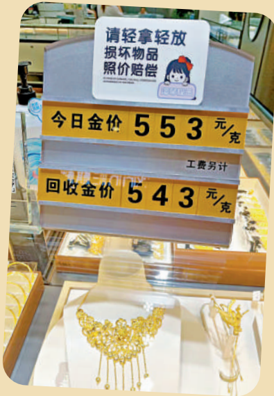
▲金價高位多頭心態鬆動，「以舊換新」業務火熱。