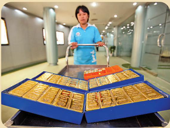
▲2024年黃金消費需求將保持強勁態勢，市場估計黃金價格有望挑戰每盎司3000美元。