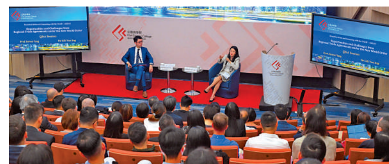
▲「聯通世界：東盟系列」的第三講。

約150名分別來自44個決策局／部門的首長級和高級公務員參加講座，當中包括本地人員和政府駐內地辦事處和海外經濟貿易辦事處（包括上海、曼谷、柏林、迪拜、日內瓦及雅加達）的人員透過網上參與。