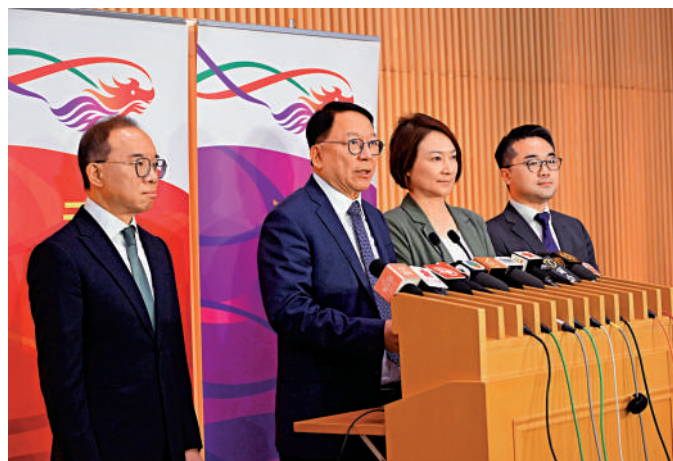
▲政務司司長陳國基（左二）表示，推展愛國主義教育工作需全社會廣泛參與。

工作小組組長李慧琼表示，小組會與政府群策群力，務求令愛國教育工作更入屋及貼地，亦會在國慶75周年活動注入愛國主義教育元素，歡迎市民表達意見，出謀獻策。