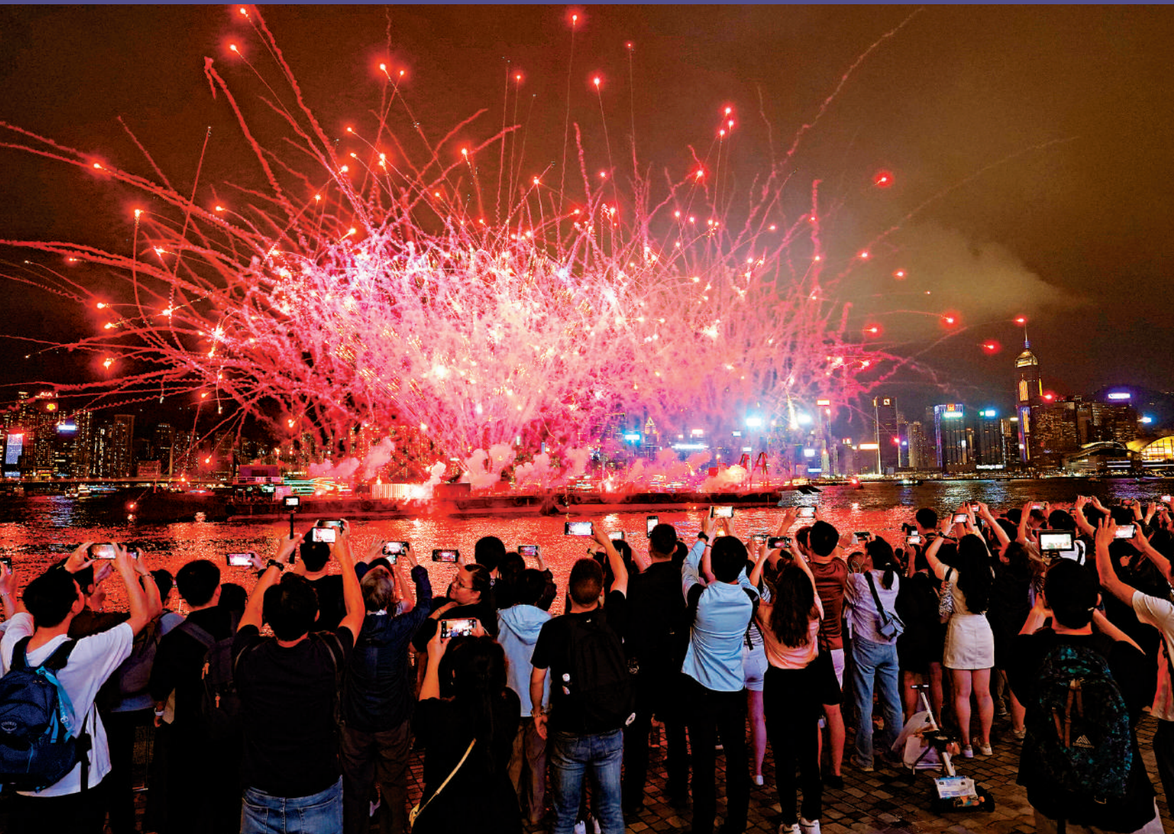
▲昨日維港海上煙火表演以金色為主調，配合「幻彩詠香江」燈光多媒體匯演，為旅客及市民送上驚喜。