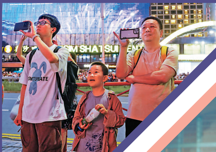
▲旅客市民昨晚前往海濱欣賞五一海上煙火表演

昨日是內地五一黃金周第一天，大批內地旅客陸續抵港，首日有190個內地旅行團來港，截至晚上9時，近40萬人次入境，各口岸運作暢順。