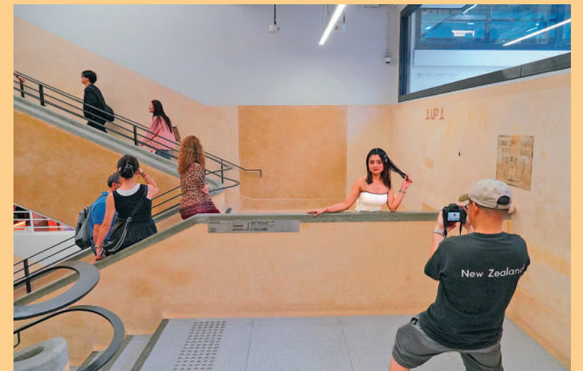
▲中環街市富有舊香港特色，是遊客打卡勝地。