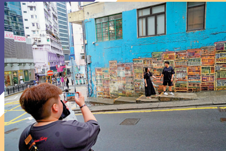
▲中上環一帶不少建築物外牆繪有特色圖畫，吸引喜歡城市漫步遊歷的旅客打卡。