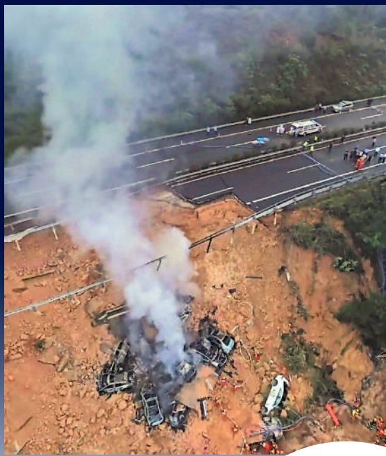
▲航拍圖片顯示，事發路段一側的兩條車道完全坍塌。