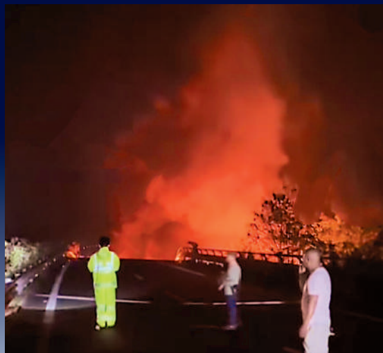
▲從途經事發路段車主拍攝的現場畫面，巨坑出現火光。

廣東多地1日遭遇強對流天氣，當日凌晨，位於廣東梅州市的梅大高速茶陽路段發生一處路面塌方，塌方路面長約17.9米，面積達184.3平方米。事發時，多輛汽車從高速墜入巨坑，其中還有汽車起火。有緊急掉頭的車輛將險情告知後方車輛，其中，來自河北的司機駕駛重型貨車抵達事故點後，聞訊後撤並不斷提醒後方車輛，重型貨車車身擋住後方車輛去路，避免事故進一步擴大。截至當日15時，事故造成24人死亡，30人受傷3留院救治，暫無生命危險。廣東省、市兩級全力開展救援，一度投入500人參與現場救援。