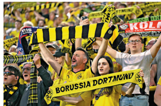
▲多蒙特4強首回合先下一城，球迷興奮慶祝。