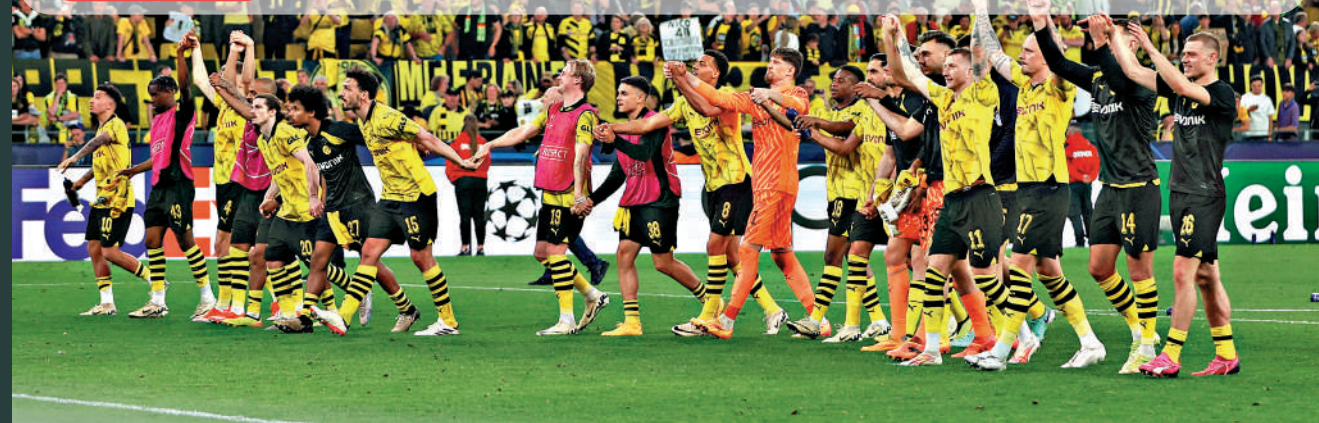
▲多蒙特球員賽後，手拖手走向場邊向球迷致謝。