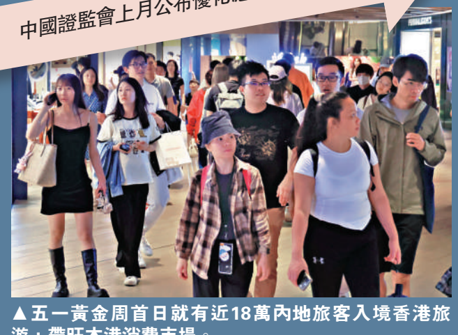
▲五一黃金周首日就有近18萬內地旅客入境香港旅遊，帶旺本港消費市場。