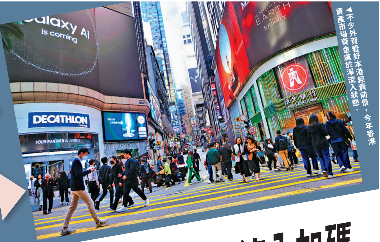
不少外資看好本港經濟前景，今年香港資產市場資金處於淨流入狀態。