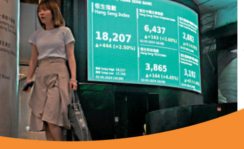
▲資金從日本流入A股、港股。

光大銀行金融市場部宏觀研究員周茂華分析，一季度中國經濟實現「開門紅」，外資對中國經濟復甦前景趨於樂觀。在海外市場劇烈波動背景下，加倉A股有助於海外投資者分散風險，「包括A股、港股在內的人民幣資產戰略配置價值已經顯現，未來外資有望保持淨買入態勢」。 大公報記者倪巍晨