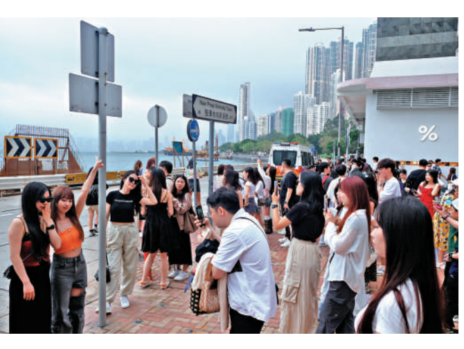
▲堅尼地城海旁要排隊輪候打卡。