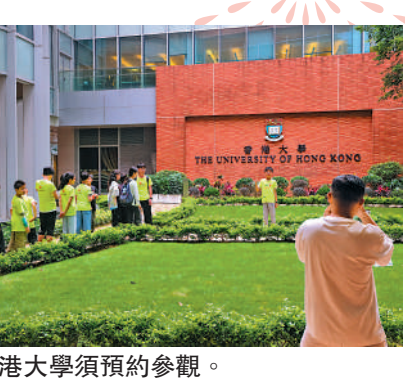
▲香港大學須預約參觀。