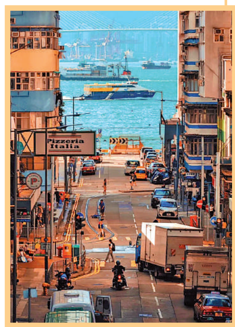
▲不少遊客來到堅尼地城遊樂場籃球場，只為帶走一幅「香港景觀」。