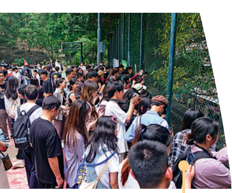
▲堅尼地城遊樂場籃球場人山人海。