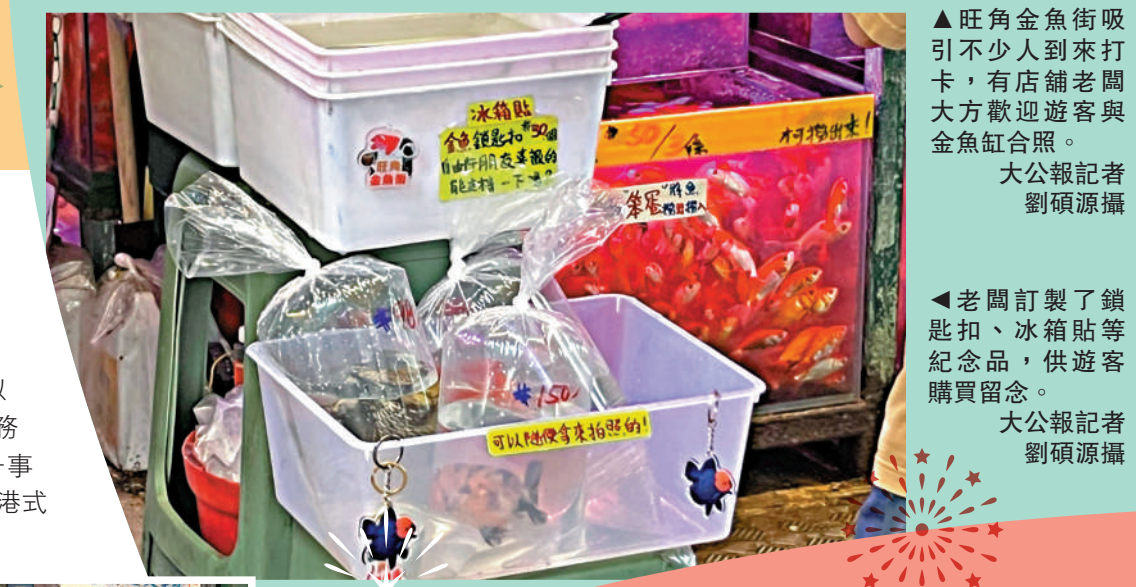
▲旺角金魚街吸引不少人到來打卡，有店舖老闆大方歡迎遊客與金魚缸合照。