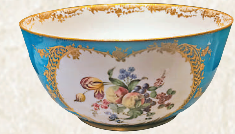
▲天藍地彩繪描金開光花果圖潘趣碗。