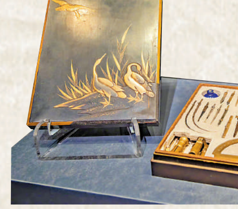
◀展覽現場的「科學學具」。

在展覽現場的中心區域，一個精美奢華的懷錶顯得格外耀眼。整體錶身為銅鍍金殼開光，錶盤中心金色百合花是法國王室的標誌，錶殼中央是路易十四像，機芯內擺輪保護罩鏤雕一條中式五爪龍。據了解，這款懷錶很可能是路易十四送給康熙的禮物，堪稱兩位帝王之間交往的重要物證。