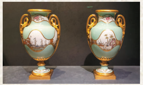
▲淺綠地彩繪描金清朝水師圖卷耳瓷瓶。

事實上，中國文化深刻影響着法國的藝術風尚。比如，對中國瓷器的仿製就是法國「中國風」藝術的重要組成部分。從17世紀下半葉開始，法國就開始關注和研究中國製瓷工藝。到18世紀中葉，法國製瓷業的造型和裝飾圖案也多受到中國的影響，其中大量的中國元素顯示出法國藝術家對中華文明的想像和崇敬。