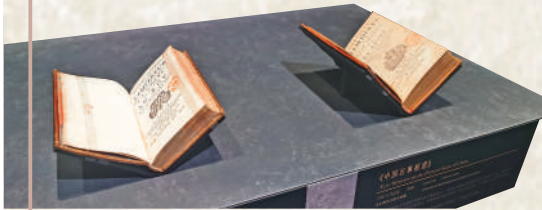
▲由法國數學家撰寫的《中國近事報道》（右）和《康熙帝傳》。

17至18世紀，中國儒家典籍和相關歷史著作通過來華傳教士的譯介在歐洲傳播。許多法國思想家將儒家思想與歐洲現實進行比較和批判，有力推動了法國的思想啟蒙運動。在展覽現場，還有《中國哲學家孔子》《中國宗教狀況見聞》《論語導讀》等珍本。