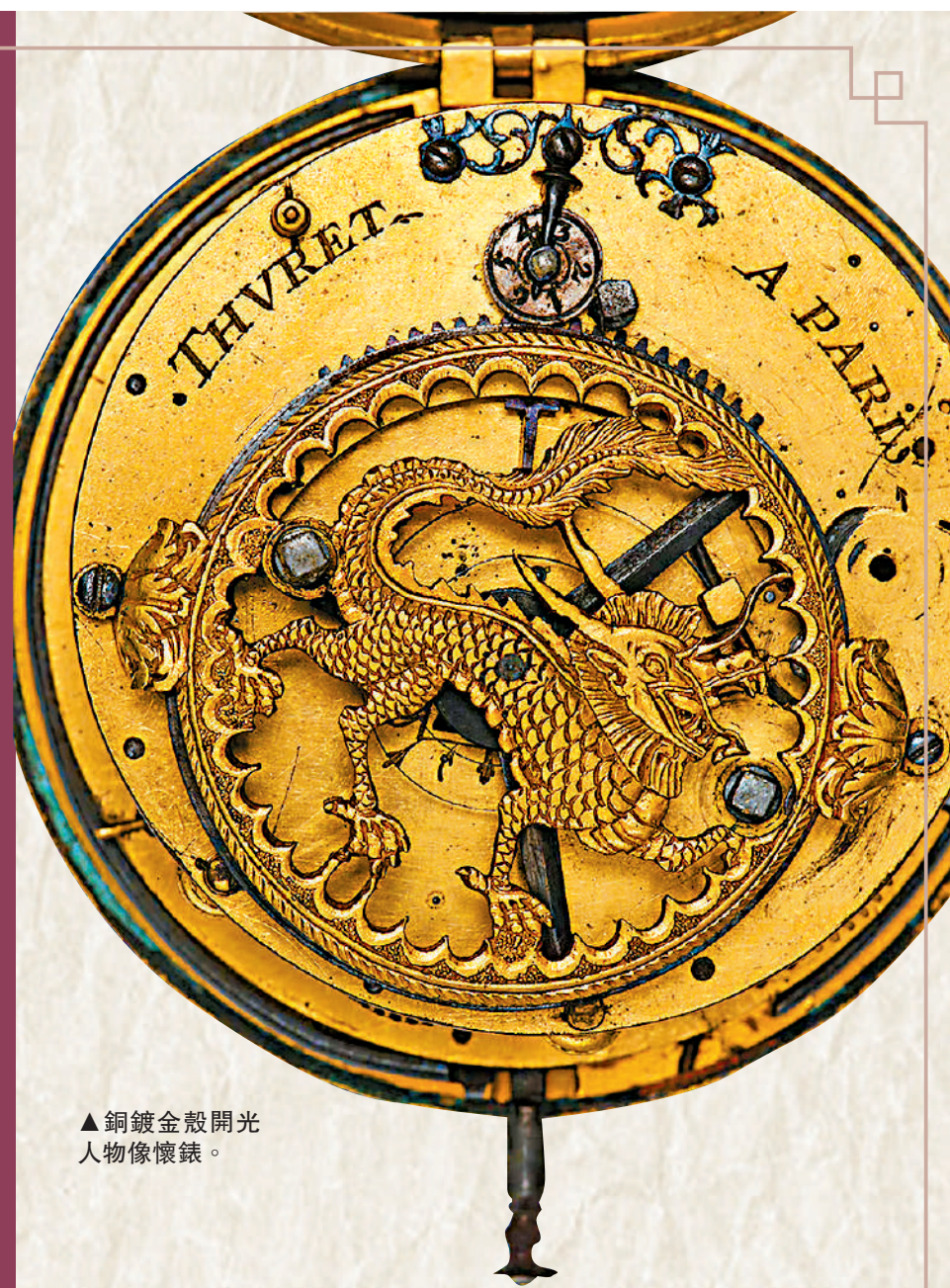
▲銅鍍金殼開光人物像懷錶。