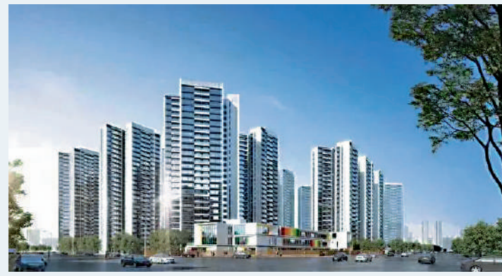
▲保利上宸住宅樓高23至27層，產品年限70年。 ◀保利上宸目前在售的戶型面積94至130平米。

隨着大灣區一小時生活圈的建設，花都區樓市需求升溫。克而瑞數據監測顯示，2023年花都區120平米以上的大單位成交共1932宗，按年大幅增長51%，升幅排在廣州第三位。廣東房協土地與產業研究中心主任趙卓文表示：「花都樓市有供少於求、庫存合理、價格窪地、抗風險強的市場優勢。」花都樓盤的可售率高，開發周期可控，風險低，投資前景可期。