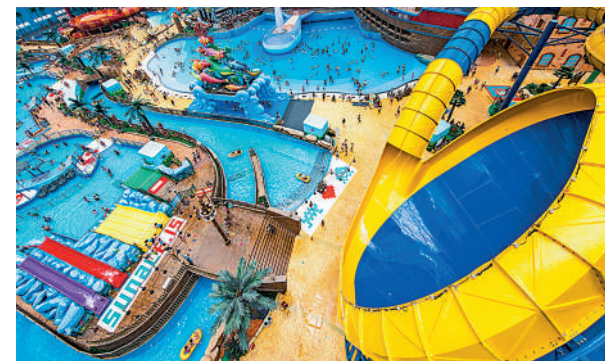
▲融創文旅城有多個樂園，包括室內恆溫水樂園。

其中，110平方米三房兩廳戶型，全數朝南，主人套房預留衣帽間；122平米為三房兩廳設計，三面採光，觀景露台橫跨客廳和其中一間睡房。銷售人員表示，花都近年在人口增長、經濟發展、城市服務品質方面都有較大提升，帶動樓盤價值提升。