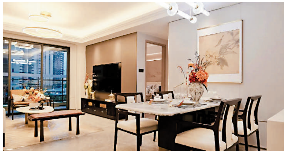
▲頤安·儷都府主力戶型為三房及四房，設計用心，採光充足。

上車之選 頤安·儷都府毗鄰融創文旅城，是深圳房企頤安集團進軍花都的首個項目，項目沒有進行抵押，即買即簽即備案，可以減少收樓延期的風險。項目樓價非常親民，每平米均價1.9萬元（人民幣，下同），入場三房戶只需約170萬元（約184萬港元）。