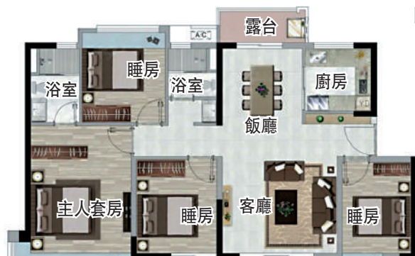
▲頤安·儷都府127平米四房兩廳戶型。