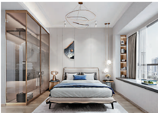
▲廣晟·中國鐵建·花語天城戶型方正實用。