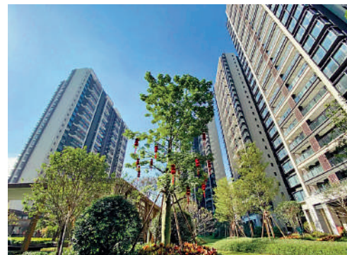
▲頤安·儷都府環境優美，綠化充足。