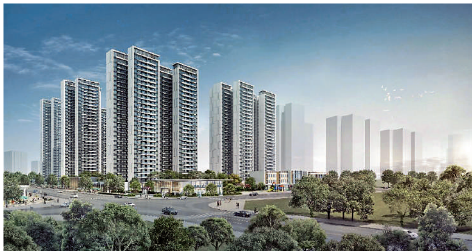
▲廣晟·中國鐵建·花語天城由24幢26至32層高住宅組成，提供3615伙。

區內少有 廣晟·中國鐵建·花語天城（下稱花語天城）靠近旅遊熱點融創文旅城，周邊設施完善，包括高端寫字樓、購物中心和豪華酒店等。花都區面積180至200平米的大平層房源一直緊張，特別是花城街文旅城板塊，項目此次推出的188平米大平層僅50伙。