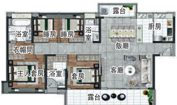
▲廣晟·中國鐵建·花語天城188平米大平層四房兩廳戶型圖。