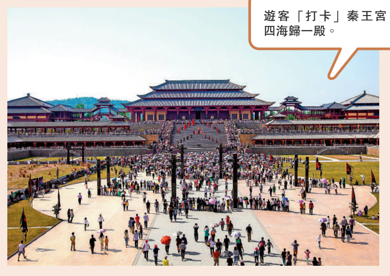
遊客「打卡」秦王宮四海歸一殿。