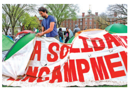
與校方達成協議後，布朗大學學生拆除營地。

【大公報訊】據美聯社報導：美國布朗大學校方4月30日率先與反戰示威學生達成協議，學生將清除校內營地，校方則將考慮從以色列撤資。截至5月3日，西北大學、新澤西州羅格斯大學等校方也分別承諾，重新審查在以色列的投資，並考慮應示威者訴求，不再與以方有生意來往。有聲音質疑這只是校方的緩兵之計，他們期望新學年開始時，巴以衝突已經平息，相關爭議則不了了之。