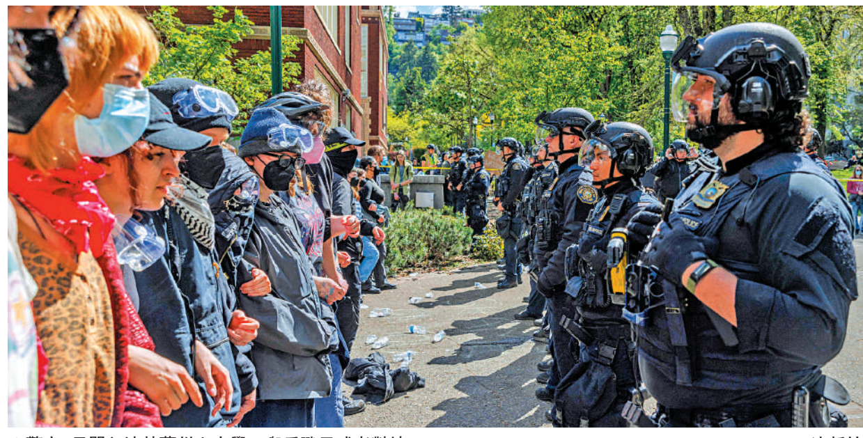
警方2日闖入波特蘭州立大學，與反戰示威者對峙。

羅格斯大學的示威者5月2日結束示威，校方承諾不會對任何參與示威的學生進行懲罰。校長康韋指出，抗議者要求從與以色列有業務往來的公司撤資，並要求羅格斯大學切斷與特拉維夫大學的聯繫；這一要求正在審查之中，但「此類決定不屬於校方的行政權力範圍」。加州大學河濱分校3日與示威學生達成協議，承諾成立一個特別工作組，探討將河濱分校的捐贈基金從加州大學管理系統中剝離。擁有10所分校的加州大學上周明確表示，反對「抵制以色列和撤資的呼籲」。費城坦普爾大學歷史教授拉爾夫認為，對一些大學來說，這可能只是讓學生結束抗議活動的拖延戰術，一些大學的董事會甚至可能永遠不會就從以色列撤資問題進行表決。