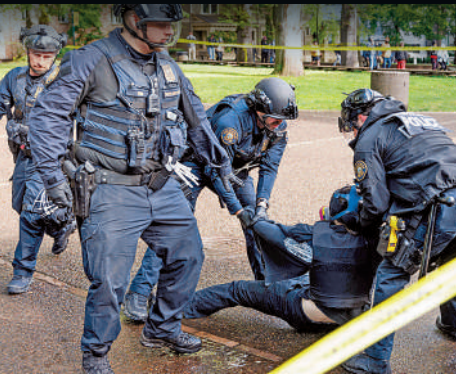
警方在波特蘭州立大學逮捕示威者。法新社

新澤西州羅格斯大學 校方同意建立一個阿拉伯文化中心，且不會對任何參與示威的學生進行懲罰。大公報整理