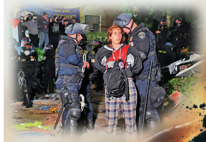
警察2日在UCLA逮捕反戰示威者。

美國大學反戰示威持續。截至當地時間4日，已有超過2400名示威者被捕。美國總統拜登2日表示，美國人享有抗議的權利，「但沒有製造混亂的權利」；他在講話中沒有對大學政策或警察強力清場發表評論。大批學生對拜登此番言論表示失望。分析指，相較於共和黨和特朗普，年輕選民和少數族裔選民更傾向支持民主黨和拜登，但拜登政府在巴以衝突和校園反戰示威上的立場可能會殃及其今年大選選情，甚至「失去整整一代選民」。