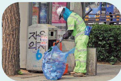
◀首爾清潔工人清理街道上的垃圾桶內的垃圾。