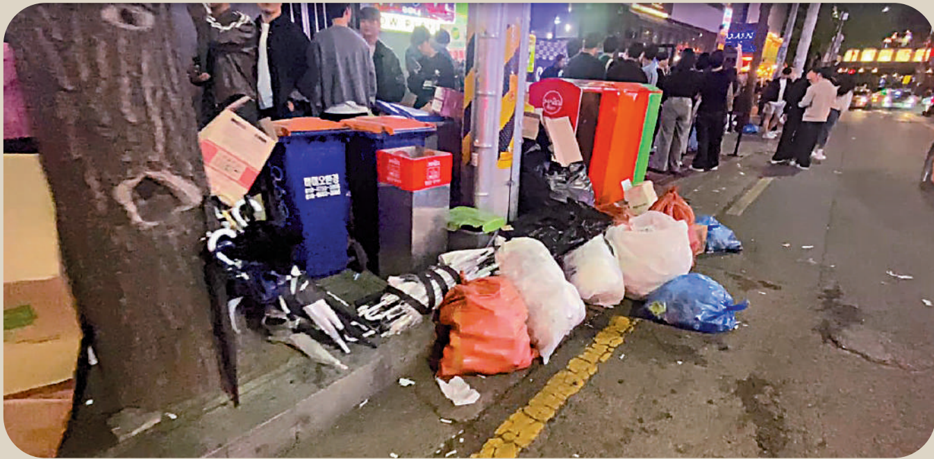
◀首爾的著名遊客區弘大，晚上經常見到垃圾隨處丟棄情況，衛生惡劣。