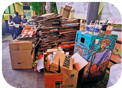
▲市民把一次性塑膠杯放在垃圾桶上，「等待」清潔人員清理回收。

事實上市民和清潔工人是否已建立「默契」？記者在原地觀察近一小時，終於等待到清潔人員出現，人員首先拉開一整袋垃圾，並把垃圾桶頂蓋的塑膠杯一併放入一般垃圾袋內，至於之後會否再分類，令人懷疑。