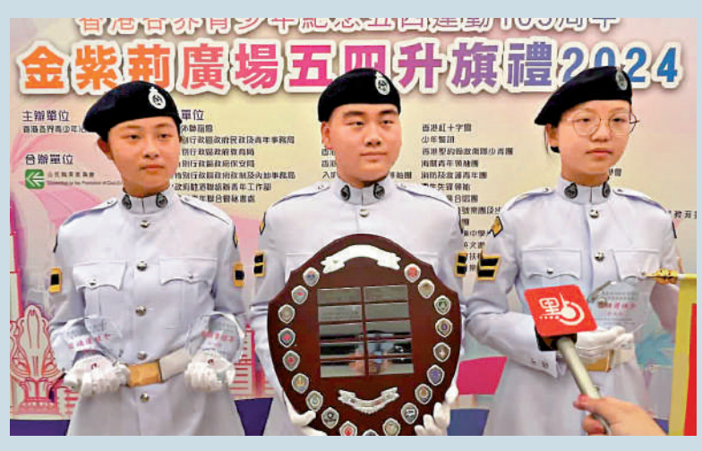
▲民眾安全服務隊少年團參與金紫荊廣場「五四」頒獎典禮，榮膺「升旗手、護旗手、擎旗手」稱號。

昨天是「五四」青年節，今年適逢五四運動105周年，儘管天氣不佳，暴雨不斷，不同團體昨天依然在全港各區舉辦活動，紀念和傳承「五四精神」。在金紫荊廣場舉行的「五四升旗禮 2024頒獎典禮」，有19隊青年團體參與。不少青年表示，通過參加活動，大家更了解祖國，增進了國民身份認同感，決心用實際行動弘揚五四精神，體現愛國情懷。