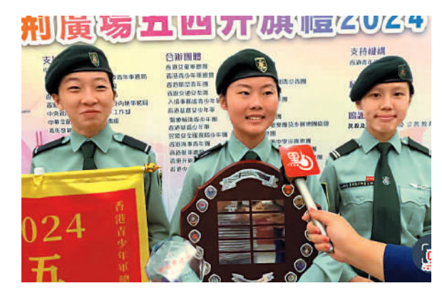
▲香港青少年軍總會亦有派員參與「五四」頒獎典禮。

透過此次活動讓青年銘記五四運動，並從中學習，學習先輩們為民族復興而無私的奉獻精神，肩負該有的擔當，不斷前進，用實際行動展現愛國愛港。政務司司長陳國基昨日在社交媒體發文，表示青年是國家和社會的未來和希望，特區政府十分關心和重視青年的發展，致力幫助香港年輕一代建立正確人生觀，成為愛國愛港，並具備抱負、正向思維和世界視野的新一代。中國青年素來就有愛國的傳統。一百多年前的五四運動，其核心就是愛國主義，一批愛國青年面對國家和民族的危急存亡挺身而出。作為中國青年的一員，香港青年也不例外，在抗美援朝期間，就有香港僑僑中學的學生回國參軍，報效國家。陳國基指出，讓愛國主義傳統在香港發揚光大，教育是非常重要的一環。只有先有了對國家、對民族的正確認知，從而認同自己的國家公民身份，並為之驕傲自豪，最後才能內化於心、外化於行，將愛國主義付諸實踐。知信行三者的統一，缺一不可。日前，「愛國主義教育工作小組」已經召開首次會議。他希望各界加入進來，共同努力在香港建立起愛國愛港的核心價值觀。