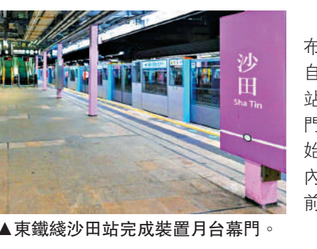
▲東鐵綫沙田站上水站月台裝好閘門。

【大公報訊】港鐵公司昨日宣布，東鐵綫沙田站、上水站完成安裝自動月台閘門，連同馬場及落馬洲站，目前共有四個車站的全部月台閘門投入服務。火炭站將會是下一個開始安裝工程的車站，港鐵表示，今年內完成總數九個車站的目標不變，目前相關工程正按既定時間表進行。沙田站因設有備用月台，港鐵團