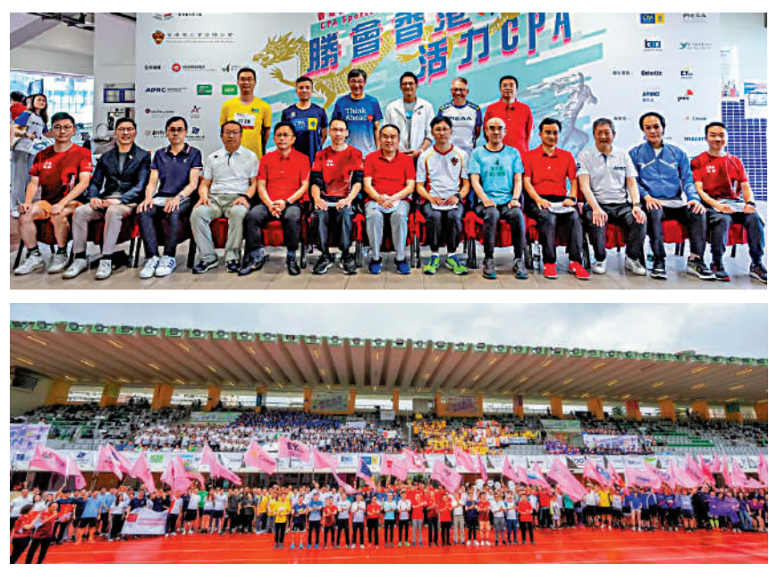
▲香港會計師公會及香港華人會計師公會聯合主辦「香港會計界第二屆運動嘉年華」，為會計界從業員提供展現運動才能的機會，多名主禮嘉賓主持啟禮。