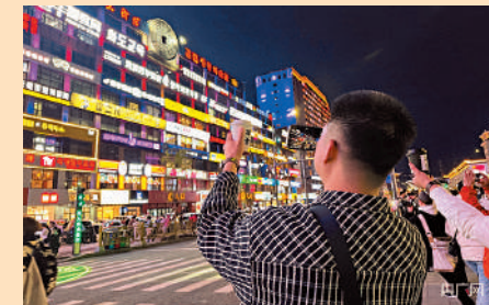
▲遊客在吉林延吉特色的「網紅牆」前打卡留念。