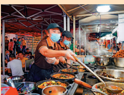
▲在廣西柳州，攤主正在製作廣西特色小吃螺蛳鴨腳煲。

初步統計，2024年第一季度，柳州市全市累計接待國內外遊客2327.21萬人次，同比增長16.0%。去年3月，柳州還開通了