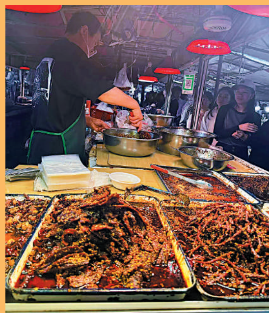
▲五一假期期間，四川自貢的小吃攤位前排起長龍，攤主忙得不可開交。