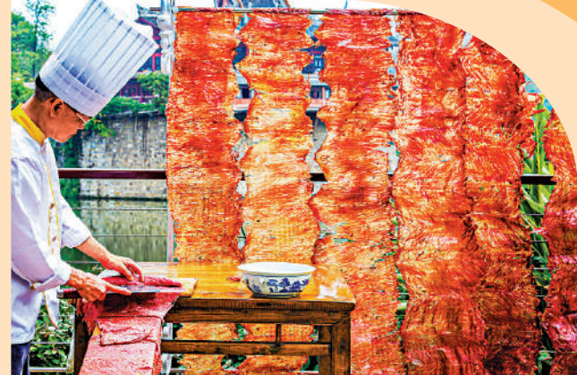
▲廚藝大師演示製作經典自貢菜式火邊子牛肉。

四川自貢，是千年鹽都、中國燈城、恐龍之鄉、美食之府。在古代中國，鹽業的形成和崛起直接決定了一個城市經濟的興旺與發達。自貢因鹽設市、鹽業發達，其名字源於四川最大的兩個產鹽區——自流井和貢井。伴隨鹽業經濟的繁榮與發展，東西南北萬商雲集、鹽船漫合，當時常年聚集在自貢的鹽商與鹽工達20萬人左右，按不同的社會分工被稱為各種行幫。來自不同地方、不同階層的行幫，飲食文化、嗜好口味亦不相同，但以井鹽、辣椒、子薑為底的調味基礎相同，歷經百餘年交融，自貢逐步形成了獨具風味的鹽幫菜系。