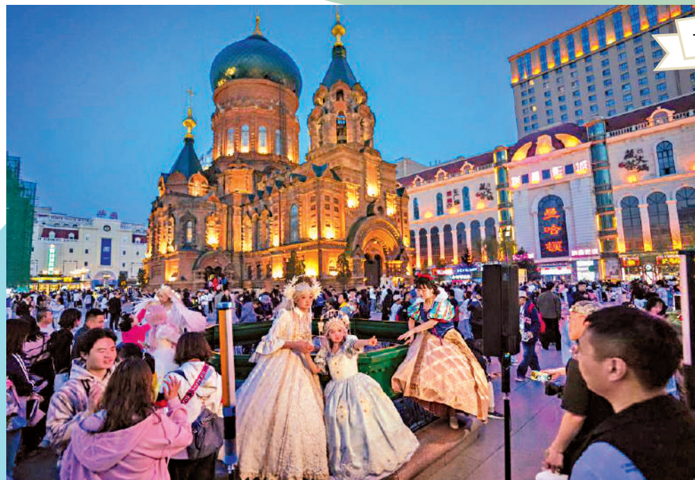
▲5月1日，遊客在哈爾濱建築藝術廣場盛裝拍照。