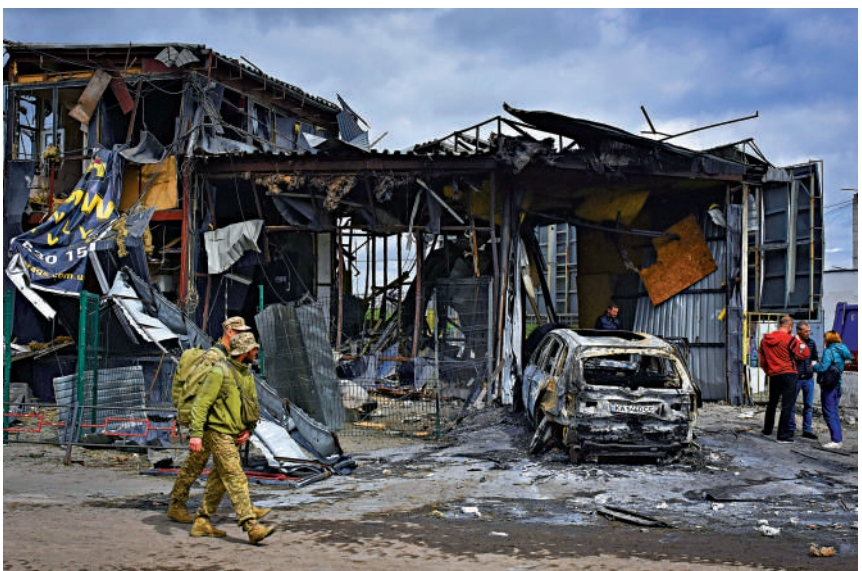
▲4月19日，烏克蘭士兵經過一片建築廢墟。

知情人士透露，貝萊德集團、太平洋投資管理公司等企業準備組建委員會，與烏克蘭協商最早於明年開始還債。烏克蘭持有未償還的200億美元歐洲債券，本次組建委員會的成員持有當中約五分之一。據稱，烏克蘭正準備於本月開始與債券持有人進行談判。