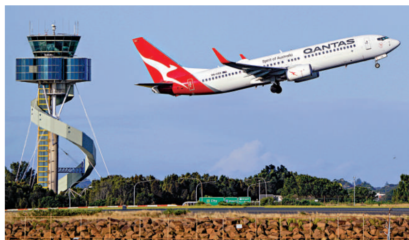
◀澳洲航空公司涉售賣被取消航班的機票遭重罰。