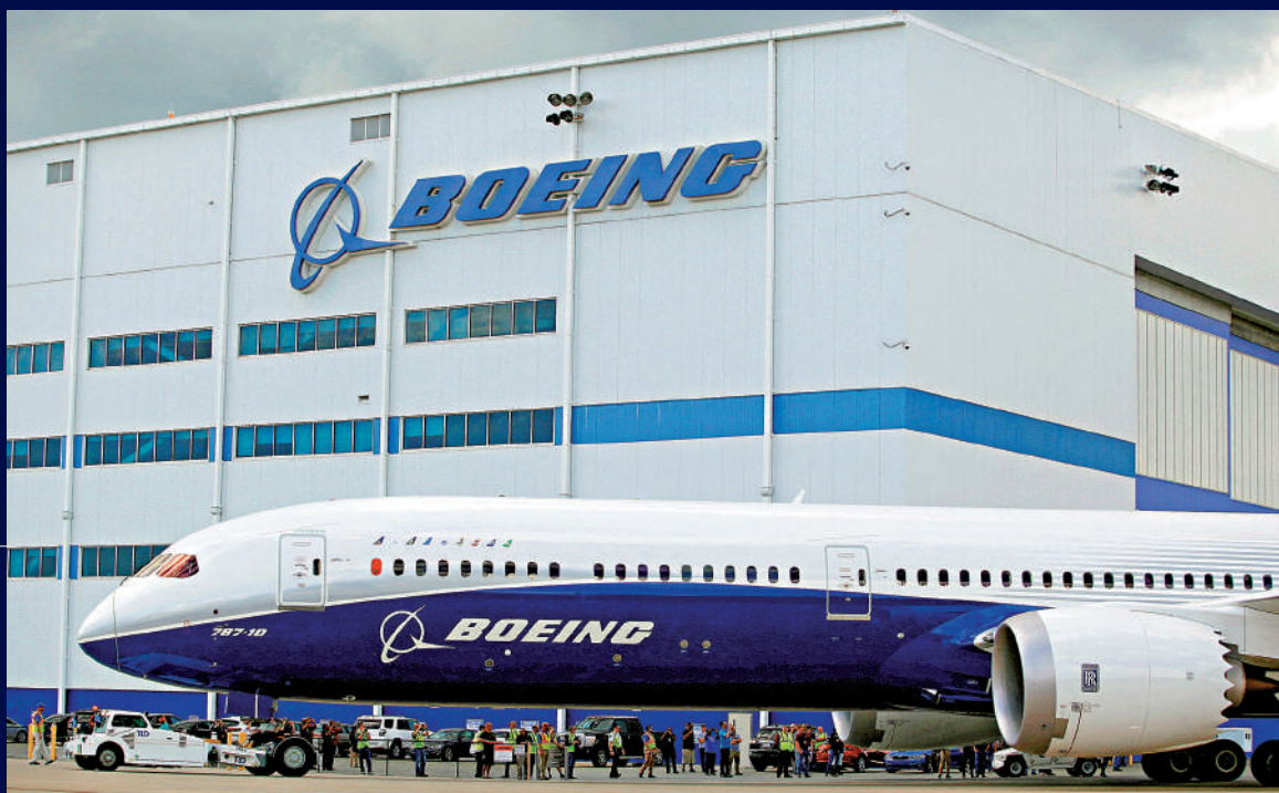
◀受零件短缺影響，波音787客機面臨交付延遲。圖為一架波音787-10「夢幻客機」。

熱交換器是飛機製造中的關鍵零件，有助於調節飛機上電子設備的溫度，以及運作空調和機艙增壓的環境控制系統的溫度，每架飛機都需要多個熱交換器以用於數個系統。