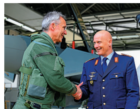
▲德國空軍司令格哈茨（右）的線上會議室可被輕易找到。

稍早前，俄羅斯媒體3月發布了一段包含4名德國高級軍官使用Webex平台討論援烏導彈的會議錄音，引發軒然大波，德國聯邦檢察官已啟動調查。