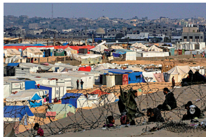
◀約120萬巴勒斯坦人在拉法避難，以軍若發動地面戰將引發災難。