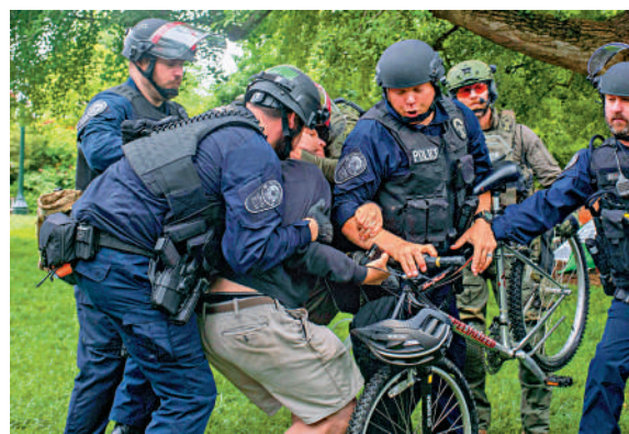
◀警方4日在弗吉尼亞大學與反戰示威者發生衝突。

哥大6日宣布取消全校畢業典禮，轉而舉辦班級日等規模較小的活動。校方稱，大部分儀式原定在發生抗議活動的曼哈頓上城區校園舉行，但如今將移至該校體育館舉行。南加州大學4月已取消了主要的畢業典禮儀式。