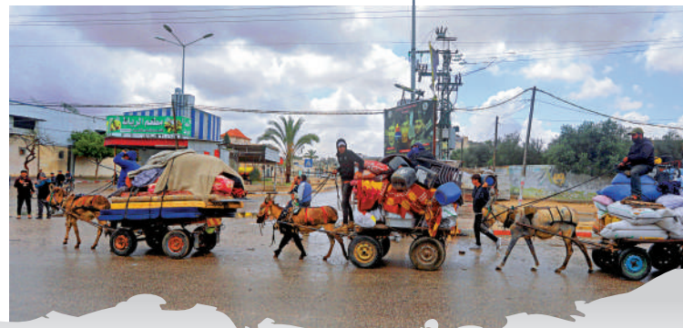
◀加沙民眾飽受戰爭和饑荒之苦。圖為拉法東部居民6日被撤離。

以色列國防部負責協調運送援助物資的領土內政府活動協調辦公室聲稱，在以色列和包括世界糧食計劃署在內的聯合國代表的會談中，沒有一個實體表示加沙北部有饑荒風險，「國際組織上周表示，必須減少運送到加沙北部的貨物數量，因為貨物數量相對於人口來說太多了」。