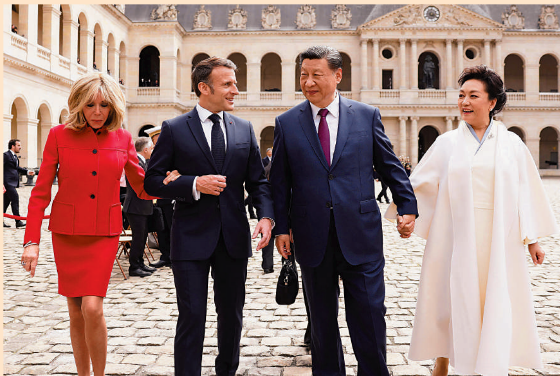
▲當地時間5月6日下午，法國總統馬克龍在巴黎榮軍院廣場舉行隆重儀式，歡迎國家主席習近平。