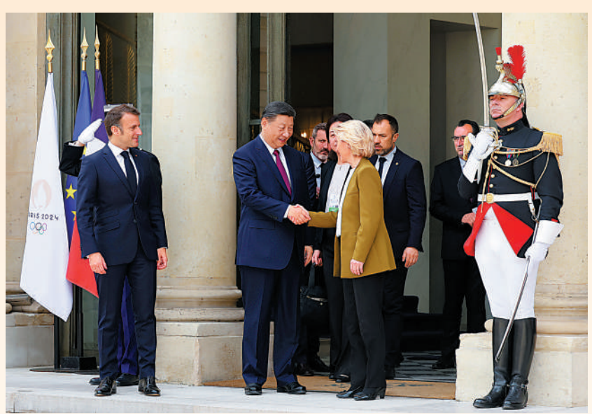
▲當地時間5月6日，國家主席習近平在巴黎愛麗舍宮同法國總統馬克龍、歐盟委員會主席馮德萊恩舉行中法歐領導人三方會晤。

馮德萊恩表示，歐中關係良好，明年是歐盟同中國建交50周年。中國在全球事務中地位作用舉足輕重，同中國保持良好關係對歐盟至關重要，也將決定能否更好應對氣候變化、烏克蘭危機等全球性挑戰。歐盟希望和中國相互尊重，求同存異，增進互信，避免誤解，