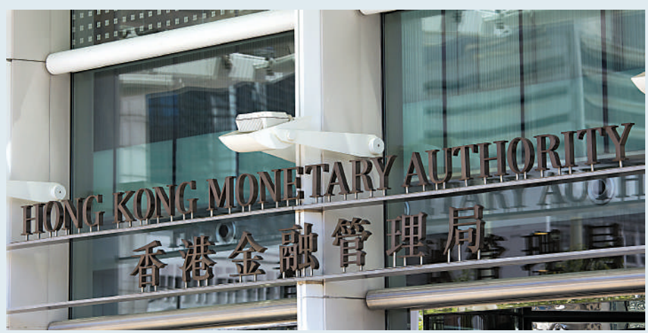
▲美國減息時間不斷推遲，構成環球經濟不明朗因素，金管局會以防禦性及流動性高的方向應對風險。