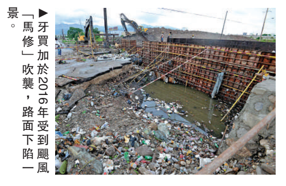
馬修加於2016年受到颶風一風

【大公報訊】保險業監管局表示，世界銀行集團旗下的國際復興開發銀行發行總額為1.5億美元（約11.7億元）的巨災債券，並安排其於香港