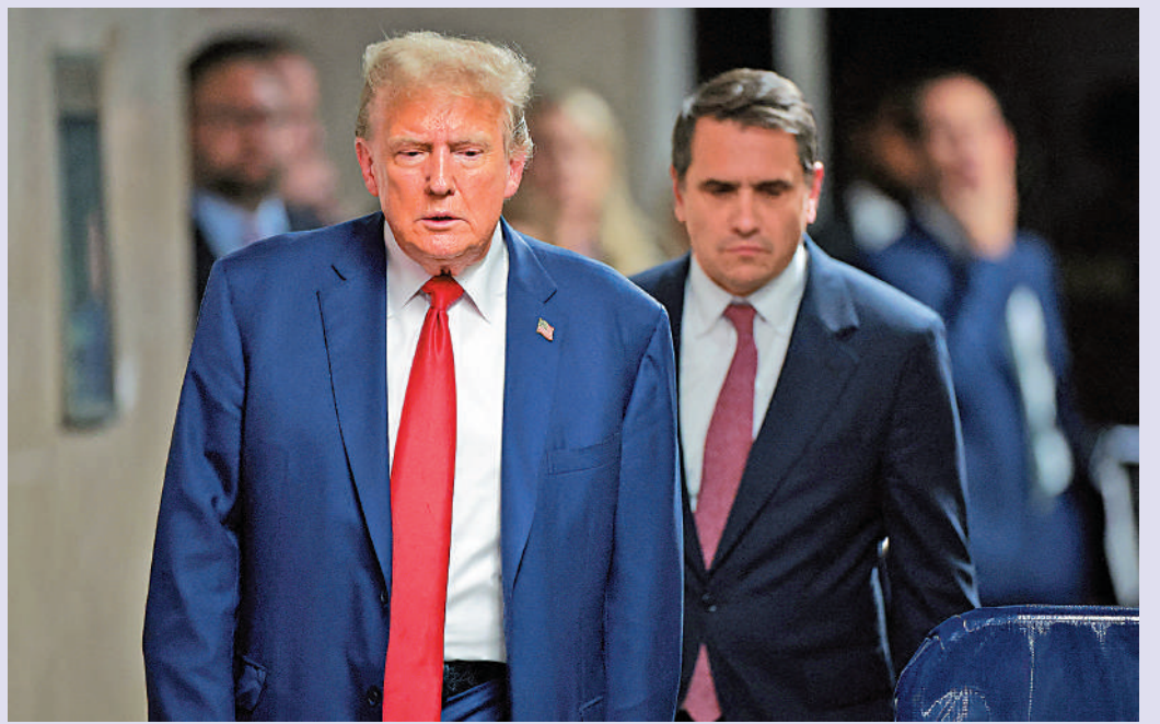
▶ 特朗普（左）6日在紐約出席「封口費」案庭審。

【大公報訊】梅爾尚6日裁定特朗普在4月22日接受採訪時的發言違反禁言令，並對其處以1000美元罰款。特朗普當時說：「你知道（法官）瘋了一樣地匆忙審判。陪審團選得太快——其中95%是民主黨人。該地區（紐約）大部分都是民主黨人……我可以告訴你這是一個非常不公平的情況。」梅爾尚表示，特朗普針對陪審團及其遴選過程發布公開聲明，「被告不僅質疑這些訴訟程序的完整性和合法性，而且再次引發了針對陪審員及其親人安全的擔憂。」 「封口費」案的禁言令禁止特朗普公開評論潛在證人、陪審員和審判中的其他關鍵人物，但不包括梅爾尚和檢察官布拉格。梅爾尚4月30日裁定特朗普在社交媒體上發表的9個帖子違反禁言令，並對每次違規行為處以1000美元的罰款。這些帖子的內容涉及批評特朗普前律師科恩和丹尼爾斯。梅爾尚6日說，此前的9筆罰款似乎未能阻止特朗普繼續違反禁言令，「特朗普先生，我最不想做的就是把你關進監獄……但如果有必要，我會這麼做的。」