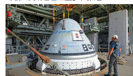
▲ 波音「星際飛機」原定6日首次載人飛行，但因技術故障延期。

「星際飛機」進度更為落後，2019年12月進行首次不載人試飛，但未能進入預定軌道。2022年5月，「星際飛機」第二次無人試飛，終於順利進入預定軌道。迄今為止，「星際飛機」的載人試飛也已經歷多次推遲。