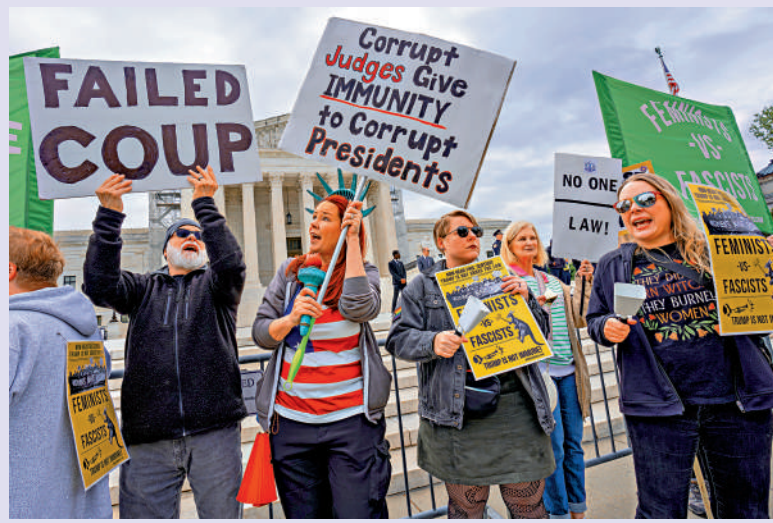
▲ 特朗普的反對者4月25日在國會山附近示威，要求依法懲罰特朗普。

美國前總統特朗普向艷星丹尼爾斯支付「封口費」案庭審已持續兩周，主審法官梅爾尚6日再次因特朗普違反禁言令裁定其藐視法庭，對其處以1000美元罰款。這是特朗普第十次違反禁言令，梅爾尚警告說，特朗普若繼續違令，可能被關進監獄。特朗普在法庭外攻擊梅爾尚，指控其「剝奪了我的憲法言論權」，並聲稱對他的刑事訴訟是「政治獵巫」。此案關鍵人物丹尼爾斯7日出庭作證，受到廣泛關注。