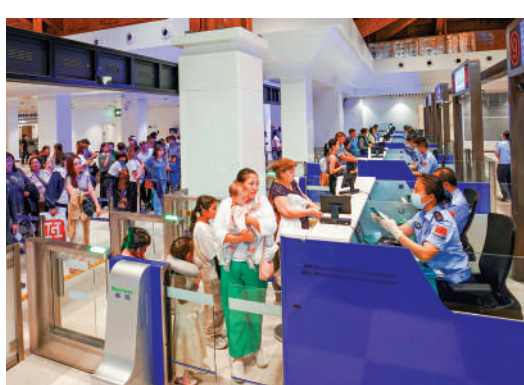
▲5月1日，入境旅客在三亞鳳凰邊檢站辦理邊檢手續。