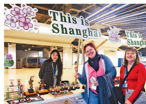
▲遊客在上海吳淞口國際郵輪港遊客通道的非遺展示攤位合影。新華社

「五一」期間，大公報記者在上海豫園隨機採訪了多位外國遊客，他們均表示，旅遊體驗很好，對城市的印象深刻。支付方面，現金支付、刷卡消費、移動支付等多樣化的方式，讓他們更付款無憂。比如來