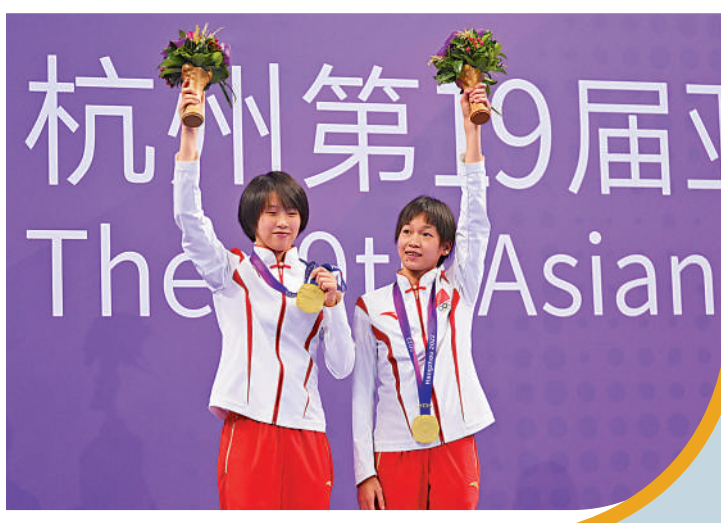
▼全紅嬋(右)與陳芋汐將二度亮相奧運。