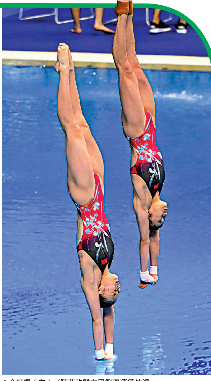
▲全紅嬋(右)／陳芋汐冀在巴黎奧運獲佳績。

分析中國跳水運動員的性格特質，陳芋汐認為是「性格沉穩、敢於拚搏」，王宗源說是「堅持不懈、永不放棄」，全紅嬋則笑着表示：「他倆把話都說完了，我完全贊同。」