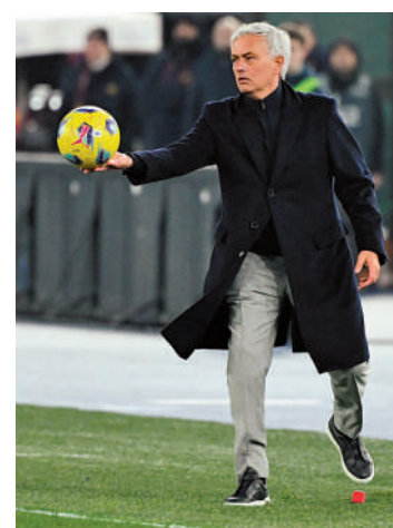
葡萄牙名帥摩連奴。

但《每日郵報》了解到，曼聯高層並沒有做出解聘坦哈格的打算。曼聯仍然有機會與曼城爭奪足總盃冠軍，在這個時間段解聘主帥十分不合適，並不能為球隊帶來短時間內的進步。在對陣水晶宮後的發布會上，坦哈格也表明，在聯賽方面曼聯仍有機會爭奪來