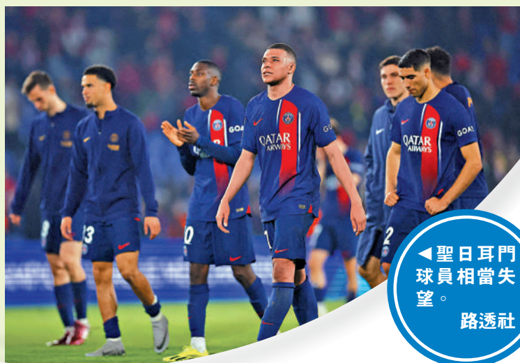
聖日耳門球員相當失望。

聖日耳門今屆歐聯運氣不濟，他們在全個賽事總共中柱14次，這是創賽事自2003至04球季有紀錄以來，單季賽事新高，安歷基對不敵多蒙特深深不忿，他表示已隊今仗已創造31次攻門，卻只收穫4次中柱，大嘆足球不公平，不過他會努力重建球隊，希望在來年再嘗試贏得這個比賽。今季歐聯射入8球的麥巴比賽後則表示非常失望，他認為自己對球隊的幫助仍然不夠，作為最要貢獻的球員，他便應該要入球，談到晉級的多蒙特，麥巴比讚賞對手踢得好，他認為多蒙特不管是進攻的禁區還是防守的禁區都有出色表現，既能力保不失，又能把握有限的機會入球。