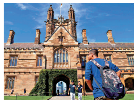
澳洲再次上調學生簽證最低存款要求。圖為學生進入悉尼大學校園。

2023年底，澳洲內政府宣布改革移民簽證制度，計劃在未來兩年內將移民人數減半。今年3月，澳洲政府宣布提高留學生和畢業生簽證的英語語言門檻。澳洲內政部長奧尼爾說，已向34家疑似在招生期間採取欺詐手段的教育機構發出警告信，要求其在半年內糾正，否則將被禁止招生，機構負責人可能面臨最高兩年監禁。