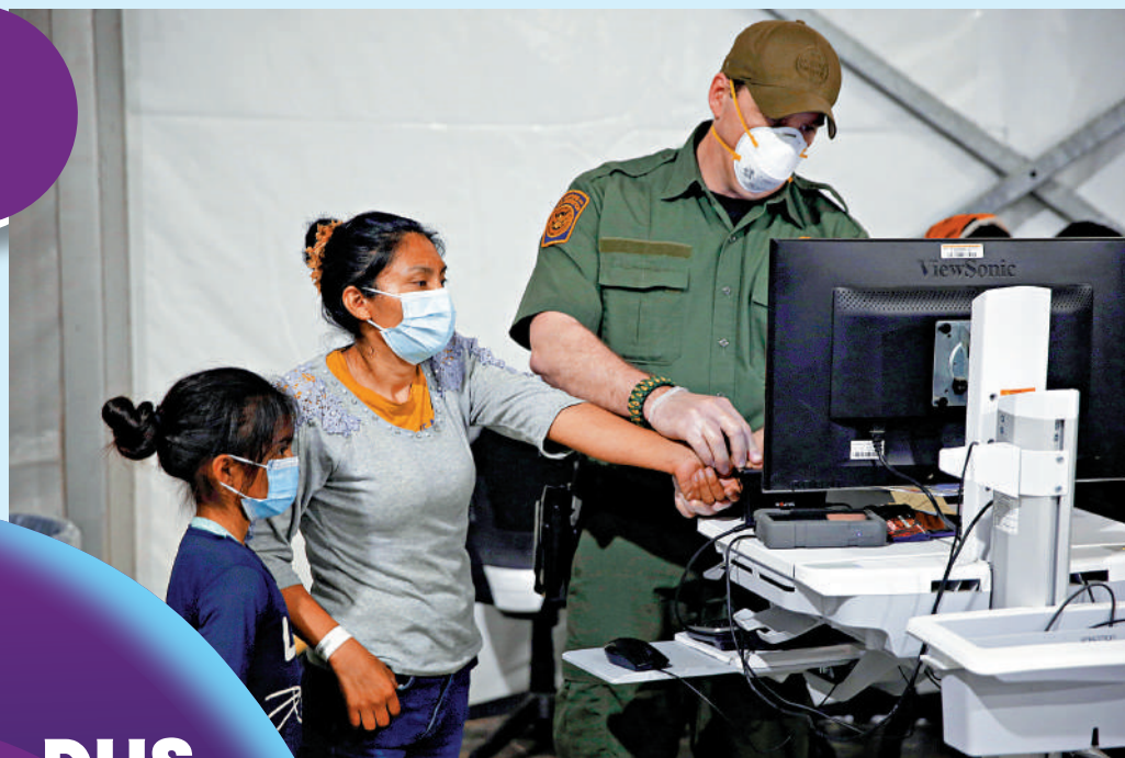
美國國土安全部讓AI模仿受過創傷的尋求庇護者。圖為得州移民逗留設施中的一名兒童。資料圖片

【大公報訊】馬約卡斯7日告訴記者，DHS正在試利用AI訓練移民官員的計劃。據他介紹，DHS首先將訓練AI模仿赴美尋求庇護的人，再讓負責審查申請者身份的移民官員與「AI難民」談話。馬約卡斯說，尋求庇護者通常曾遭受創傷，不願談論自己的經歷，「因此我們也讓AI表現得沉默寡言」。DHS表示，該部門計劃基於生成式AI技術開發一款互動應用程式，作為移民官員培訓的補充項目。