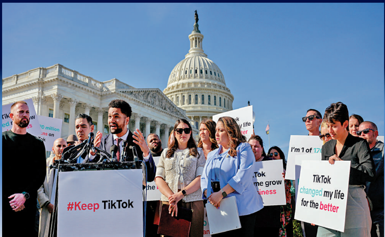
▲TikTok博主和反對封禁該平台人士在國會山集會抗議。