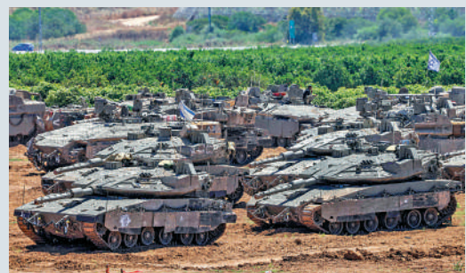
▲以軍坦克8日向加沙邊境行進。

以色列官員表示，該事件在以政府內部引發嚴重擔憂。美媒稱，以軍對拉法發動進攻後，美以之間的分歧加劇。