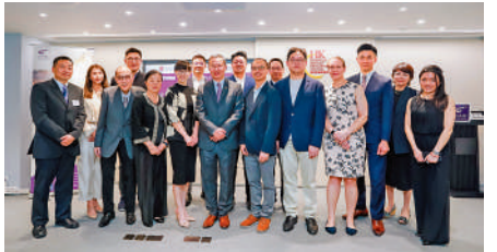
▲中大家族企業研究中心昨獲香港家族辦公室協會和NxGen Visionaries捐款。

此外，香港中文大學家族企業研究中心獲香港家族辦公室協會和NxGen Visionaries合共捐贈125萬元，並宣布設立「家族企業獎」及「多家族辦公室」研究項目。