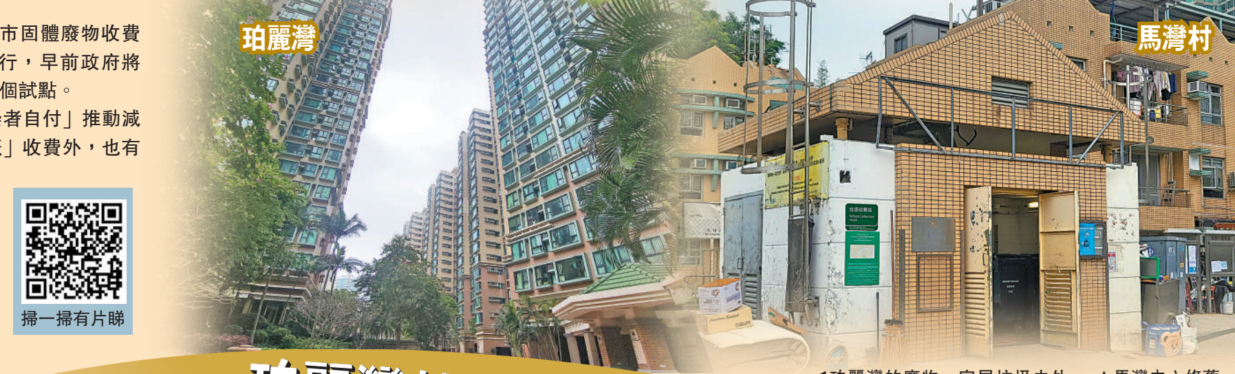
▲珀麗灣的廢物、家居垃圾由外判清潔公司收集後送往馬灣廢物處理中心，須繳交「入閘費」。▲馬灣內六條舊村的居民將需要使用指定垃圾袋，要適應垃圾分類回收的生活習慣改變。

原定在4月1日實施的都市固體廢物收費（垃圾收費）延遲執行，早前政府將「先行先試」範圍擴大至14個試點。垃圾收費是透過「污染者自付」推動減廢，除「按袋」或「按標籤」收費外，也有按重量收「入閘費」的方式，位於馬灣的私人屋苑珀麗灣便以「入閘費」作垃圾收費。馬灣內六條舊村的居民將需要使用指定垃圾袋。村民固然要適應垃圾分類回收的生活習慣改變，惟舊村欠缺廚餘回收等設施，恐大大增加村民的負擔；即使住在珀麗灣的居民，同樣指廚餘回收是應對垃圾收費的一大顧慮。