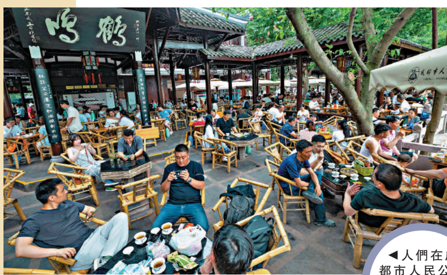
人們在成都市人民公園內的鶴鳴茶社喝茶休閒。

德格印經院是中國藏族聚居區三大印經院之一，完整保存雕版檔案325520塊，囊括了十一世紀以來的各類重要藏文經典文獻。