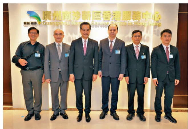
廣州南沙新區香港服務中心新址啟用，梁振英等嘉賓參加啟用儀式。

值得一提的是，香港居民可以通過智能櫃檯企業開辦模塊按照系統提示完成企業註冊，如若在填報過程中遇到障礙，可通過「元宇宙政務大廳」連線「虛擬政務數據人」，現場進行一對一諮詢，確保申請人完成信息填報。