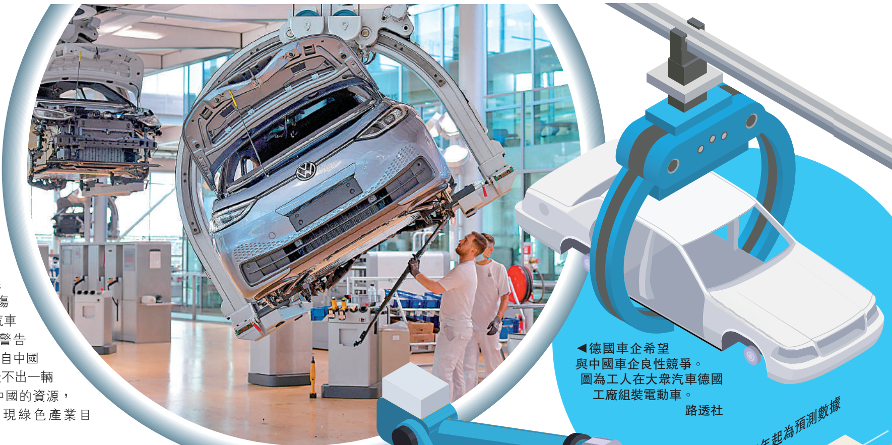
德國車企希望與中國車企良性競爭。圖為工人在大眾汽車德國工廠組裝電動車。路透社

近年越來越多的德國車企在華設廠，加強電動車研發。寶馬上月26日宣布，將繼續深化在華布局，增資200億人民幣用於華晨寶馬大東工廠的大規模升級和技術創新。杜登赫費爾直言，中國對全球汽車工業的重要意義在於其在轉型中的先驅作用。「汽車發展的未來在中國，如果帶着保護主義措施面向未來，將鑄成大錯。」（路透社、《金融時報》）