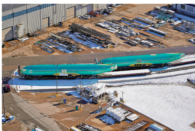
「勢必銳」公司為波音生產的機身被揭存在大量缺陷。資料圖片

【大公報訊】綜合BBC、美聯社報導：波音飛機8日再次發生事故，美國聯邦快遞航空一架波音767貨機在土耳其其機場降落時疑似無法打開起落架，機頭貼着跑道向前衝，現場火花四濺，幸而未造成人員傷亡。波音最大供應商「勢必銳」航空系統公司前員工爆料稱，他和同事們經常發現向波音供應的零件存在問題，甚至一次能發現多達200處缺陷。