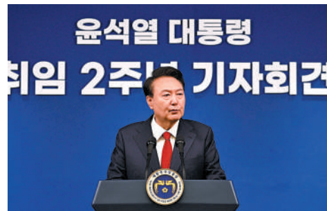
尹錫悅9日就妻子收受名牌包向韓國國民道歉。

尹錫悅稱，因妻子不夠明智的處事方式讓國民擔憂，他就此表示歉意。對於檢方已開始調查該事件的情況，他說，就該問題表態可能會引發施加影響力的誤會，