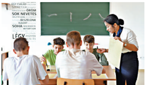
2023年2月，中國教師在匈中雙語學校指導學生們學習書法。

特稿 匈牙利首都布達佩斯，匈中雙語學校大廳牆上始終掛着習近平主席與師生們的合影。那是2009年，中匈建交60周年，時任國家副主席習近平對匈牙利進行正式訪問，其間考察了這所匈中雙語學校。匈中雙語學校成立於2004年9月，是中東歐地區第一所使用中文和所在國語言教學的公立全日制學校。當時，學生們用中文在黑板上寫下歡迎語：「習伯伯，您好！」還演唱中文歌曲，表演芭蕾舞和武術節目。習近平用中國古語「十年樹木，百年樹人」寄語學校發展。學生們贈送給習近平一件手工製作的禮物，上面畫着一顆小紅心，旁邊寫着暖心的祝福。2023年春節前夕，匈中雙語學校的學生胡靈月、宋智孝代表全校學生致信習近平主席和夫人彭麗媛教授，表達將來到中國上大學、為匈中友好作貢獻的願望。不久，她們就收到習近平主席覆信。「得知你們長期堅持學習中文，立志為中匈友好作貢獻，我為你們點讚。」習近平主席在信中說，歡迎你們高中畢業後到中國讀大學，也希望越來越多的匈牙利青少年喜歡上中文、學習中文，有機會到中國走一走、看一看，更多地了解當今中國和中國的歷史文化，努力做傳承發展中匈友好事業的使者。