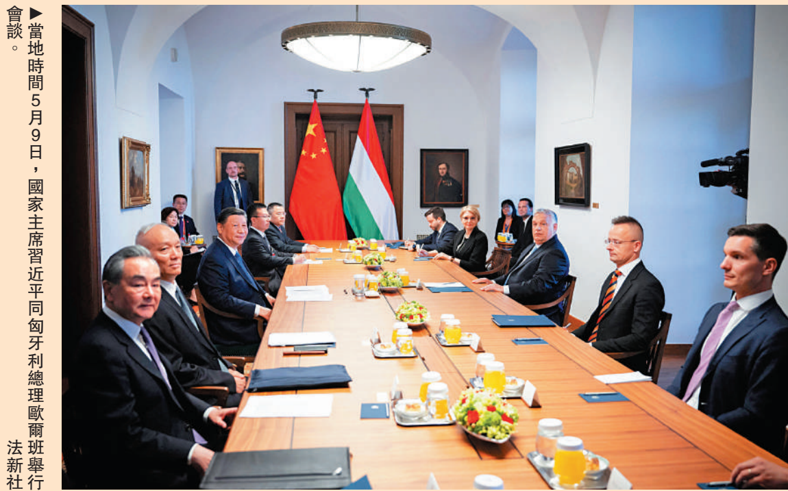
當地時間5月9日，國家主席習近平同匈牙利總理歐爾班舉行會談。