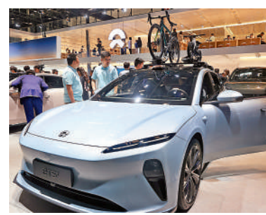
▲蔚來表示，從0到1的階段，基本完成了從0到1的階段。

對於小米(01810)與華為加入汽車市場，李斌表示，華為、小米這些手機廠商入局，的確為行業帶來新鮮的話題，競爭多了，當然壓力會變大，但這也是一個