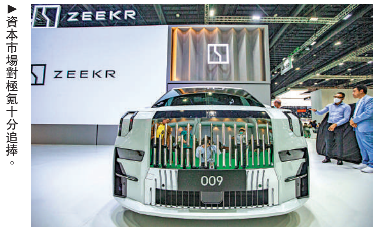
▲資本市場對極氪十分追捧。

分析認為，吉利的資源押注極氪，使其快速崛起，成立3年已賣24萬輛車，成功為極氪打入豪華車陣營。值得注意的是，極氪人才班底聚集了吉利、領克和歐洲三方人員，這些技術人員開發出了極氪多款車型。然而，早前小米SU7創始版開售，迅即秒售罄，展現的恐怖戰力，令人擔心極氪001會受到傷害。市場人士估計，小米SU7明顯是要從極氪001手中搶奪客戶，料雙方將在逾20萬元人民幣車價市場一較高下，誰勝誰負將影響甚大。