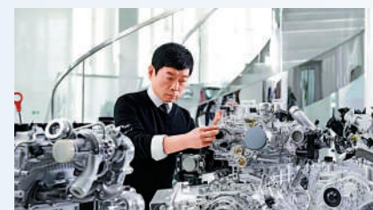
▲魏建軍預料，未來三年汽車行業的競爭強度不會減少。