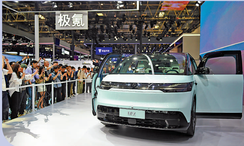
▲極氪周五在美國上市，獲得超額認購。極氪成立3年已賣出24萬輛車。