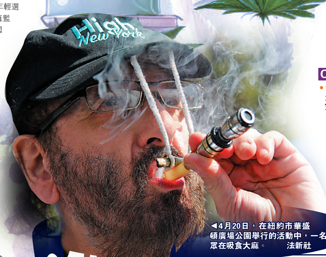
▲4月20日，在紐約市華盛頓廣場公園舉行的活動中，一名民眾在吸食大麻。

2012 2013 2014 2015 2016 2017 2018 2019 2020 2021 2022 2023