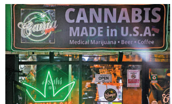
▲泰國曼谷考山路上一家大麻店前掛著「美國製造」的牌子。

麻的過程過於倉促，造成社會問題，導致大眾普遍對如何監管大麻的銷售和使用感到困惑。