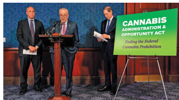
▲5月1日，美國民主黨參議多數黨領袖舒默 (中) 就《大麻管理和機會法案》發表講話。