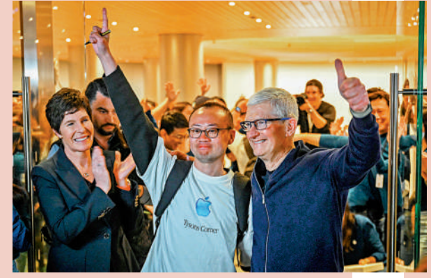
▲3月27日，在上海蘋果零售店開幕儀式上，蘋果公司首席執行官庫克發起大擁擠，為中國點讚。