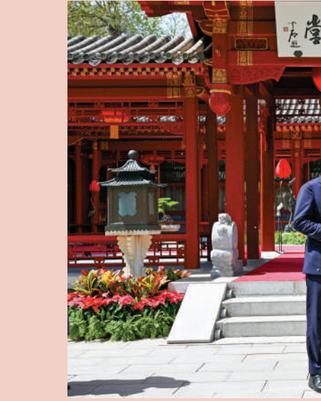
▲4月16日上午，國家主席習近平在北京釣魚台國賓館會見德國總理朔爾茨。

地點：人民大會堂 議題：相互尊重、和平共處、合作共贏。 中方：兩國應該做夥伴，而不是當對手；應該彼此成就，而不是互相傷害；應該求同存異，而不是惡性競爭；應該言必信、行必果，而不是說一套、做一套。 美方：美方不尋求「新冷戰」，不尋求改變中國體制，不尋求遏制中國發展，不尋求通過同盟關係反對中國，無意同中國發生衝突。