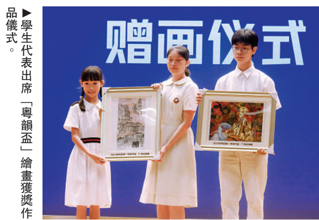
學生代表出席「粵韻盃」繪畫獲獎儀式。

為傳承中華文化，加強粵港澳三地青少年交流，發展壯大愛國愛港愛澳力量，由廣東省、香港特區、澳門特區三地教育部門聯手合作推動的2024年「粵韻灣區盃」作文與美術主題大賽昨日在香港麗澤中學啟動。大賽即日起歡迎粵港澳三地中小學生投稿，以寫作或美術創作的形式，表達在粵港澳大灣區民俗文化薰陶下成長的所見所感所悟，展現青少年豐富的精神世界和創造力。