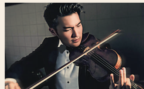
▲陳銳小提琴演奏會將於6月7日及8日在香港大會堂音樂廳舉行。

陳銳小提琴演奏會將於6月7日及8日在香港大會堂音樂廳舉行，現於城市售票網(www.urbtix.hk)發售。電話購票可致電3166 1288。