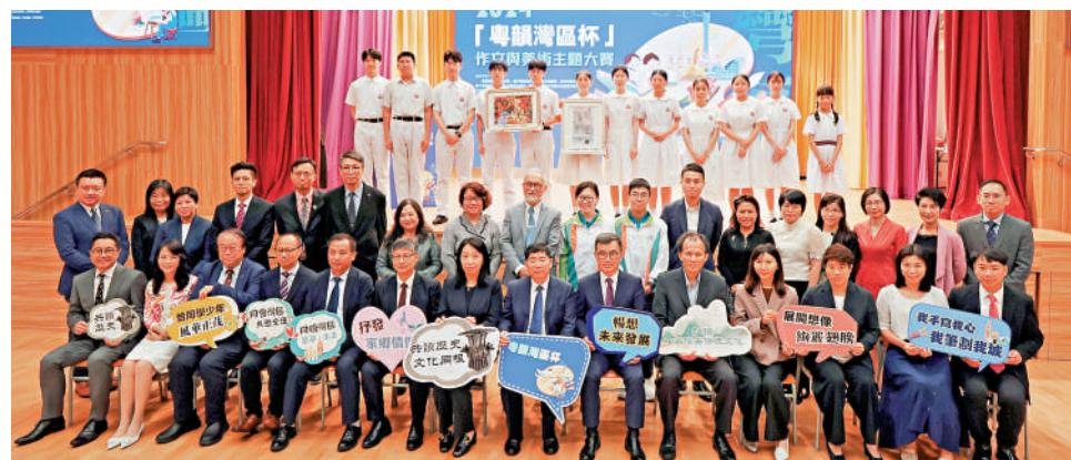
眾嘉賓出席「粵韻灣區盃」作文與美術主題大賽啟動儀式。

本次大賽由廣東省教育廳、香港特區政府教育局、澳門特區政府教育及青年發展局、廣州市教育局、第十五屆全國運動會廣州賽區執委會、廣東省粵港澳大灣區文化教育交流中心擔任指導單位，並由廣州日報社、廣東教育出版社共同主辦，旨在提升粵港澳青少年的家國意識，激發他們投身粵港澳大灣區建設、融入國家戰略的主動性和積極性。