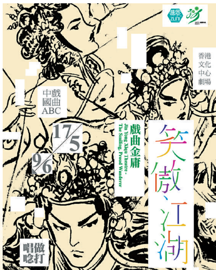
▲《戲曲金庸·笑傲江湖》5月17日起於香港文化中心劇場公演。

門票由即日起於城市電腦售票網及進念售票平台ZUNI TICKETING 公开发售，設有不同票務優惠。